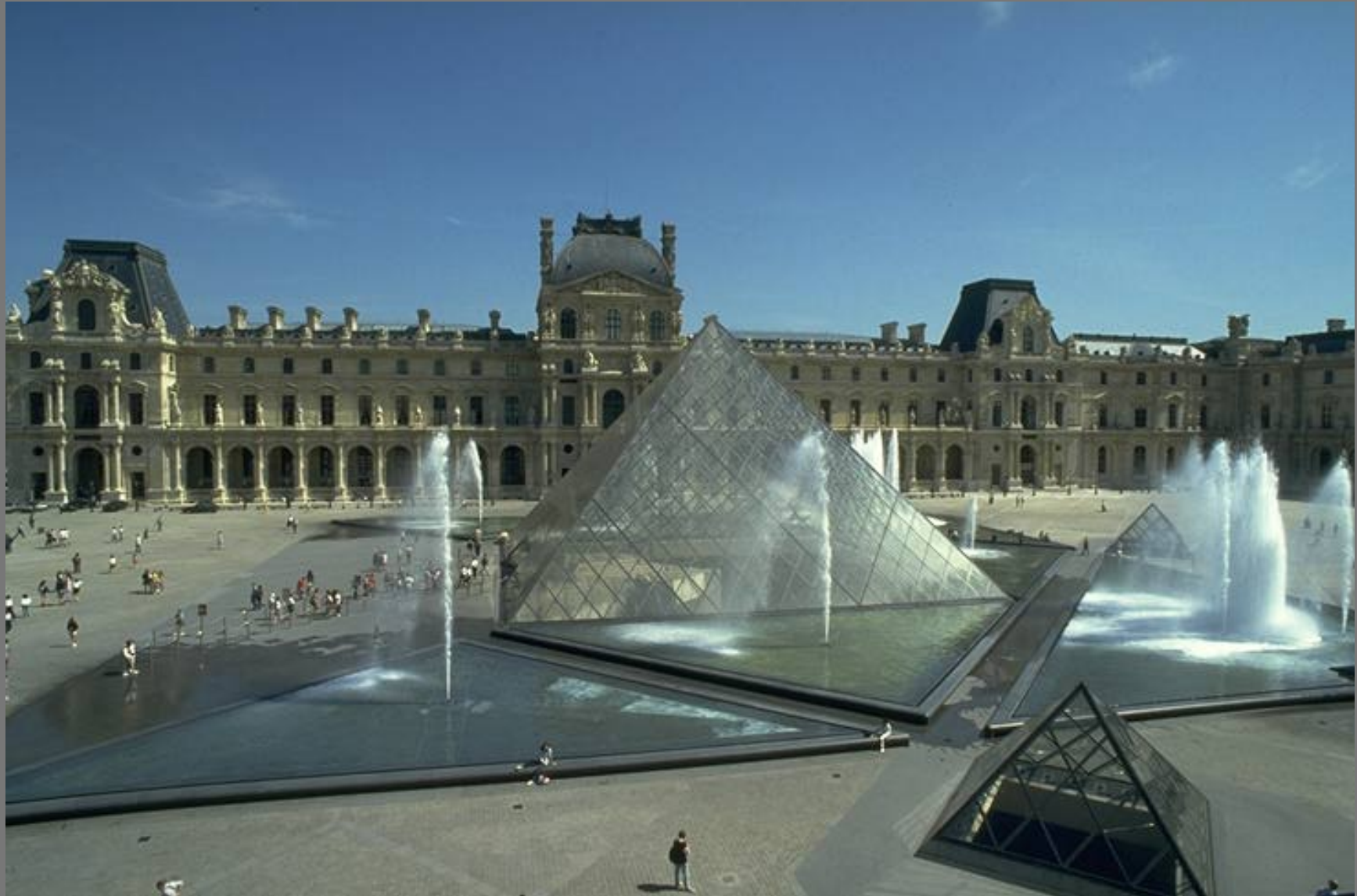
พระราชวังลูฟว์