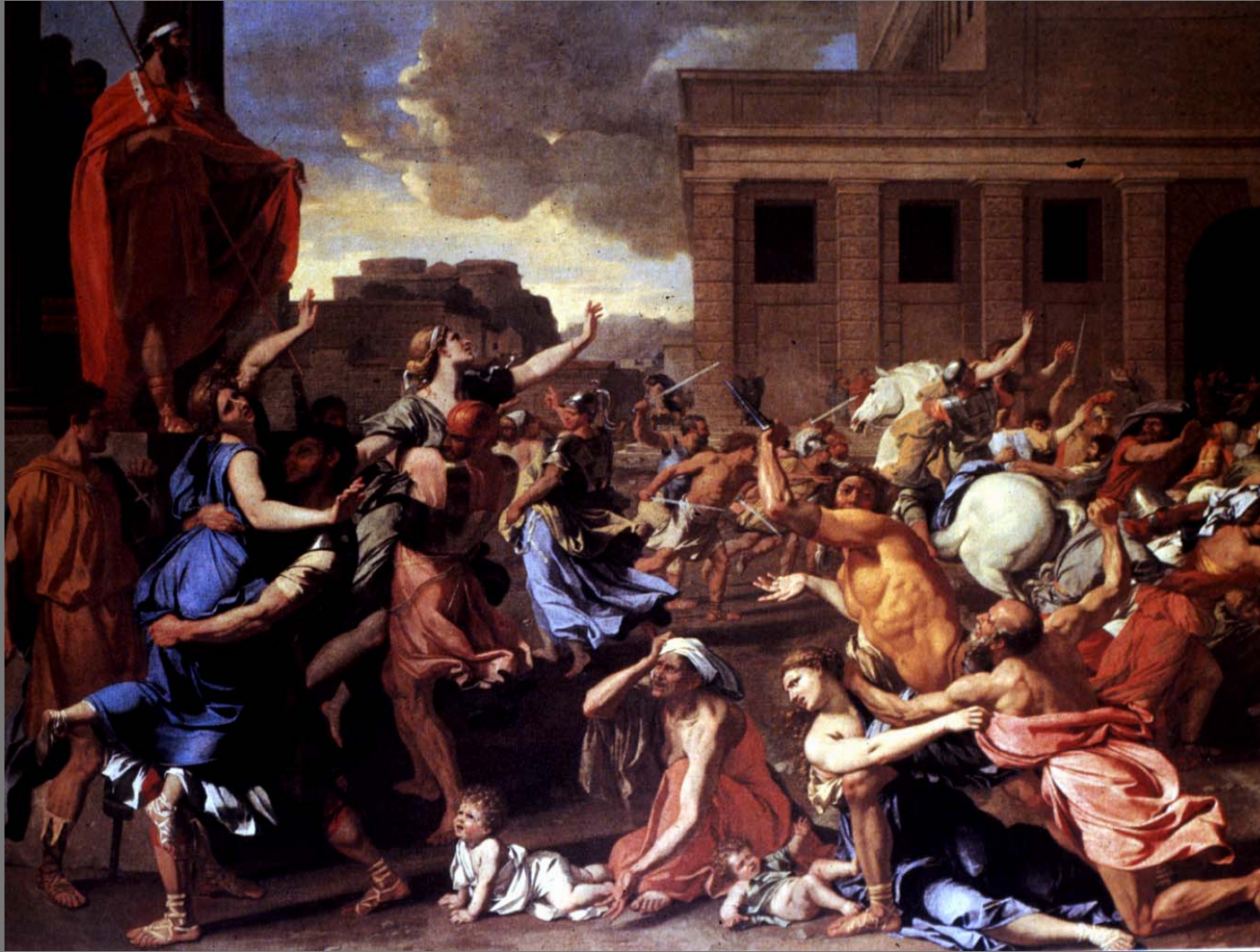
The Rape of the Sabine Women

ค.ศ.1636 – 37 ขนาด 61 X82 ½ นิ้ว สีน้ำมัน