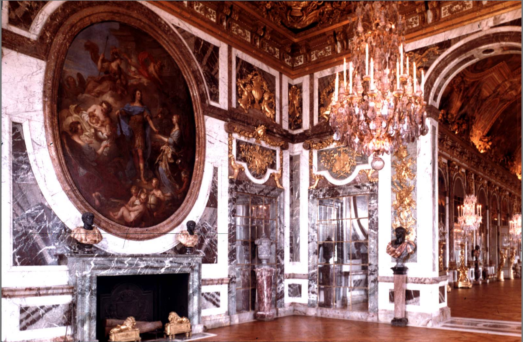
The Peace Room