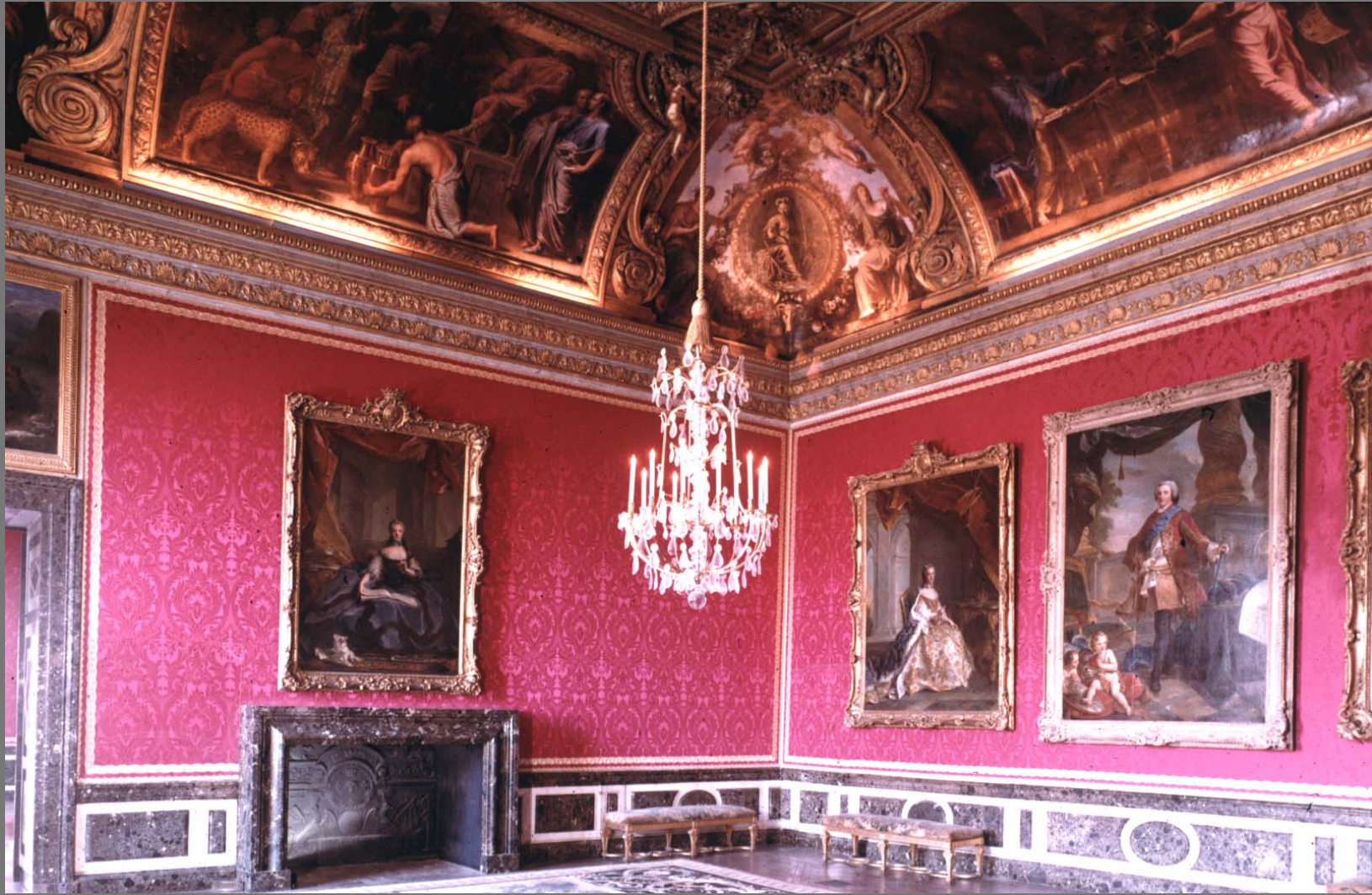
The Mercury Room