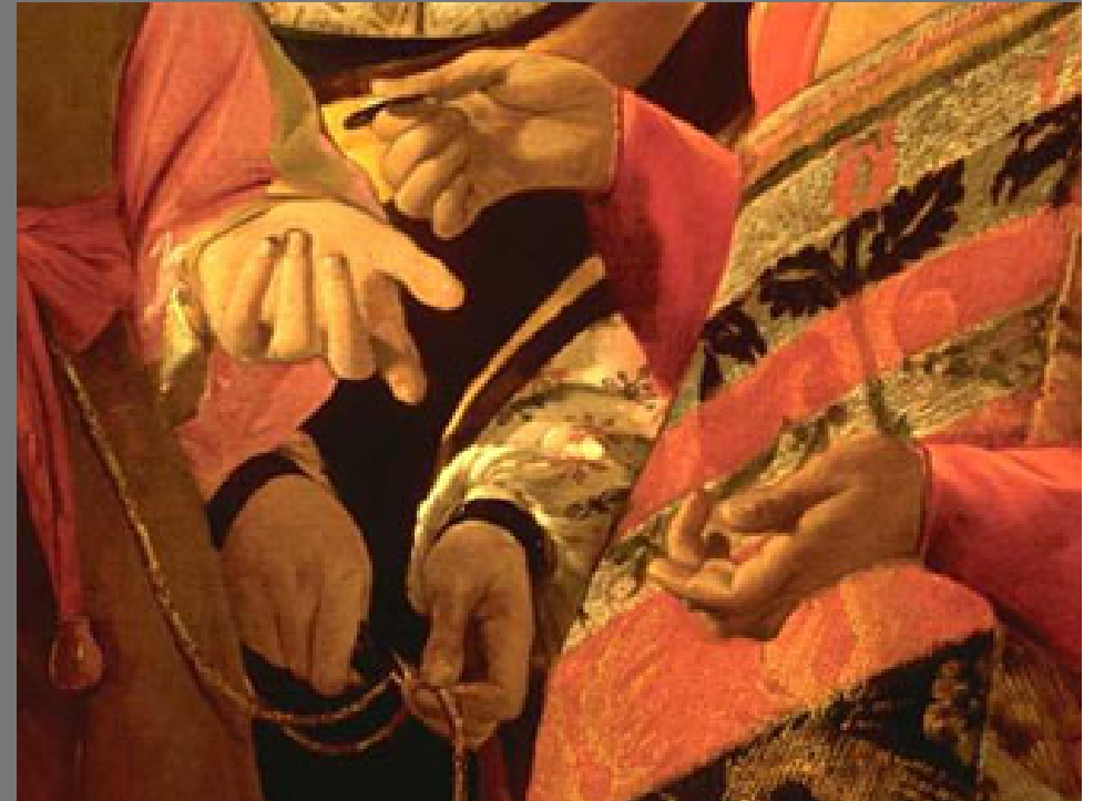
เดอ ลา ตูร์ Fortune Teller