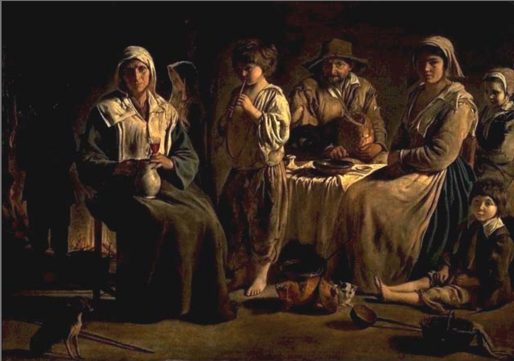
Peasant Family (ครอบครัวของชาวนบต) หลุยส์ เดอ นัง

สีน้ำมันบนผ้าใบ ค.ศ.1640 กว้าง 62 นิ้ว สูง 44 นิ้ว