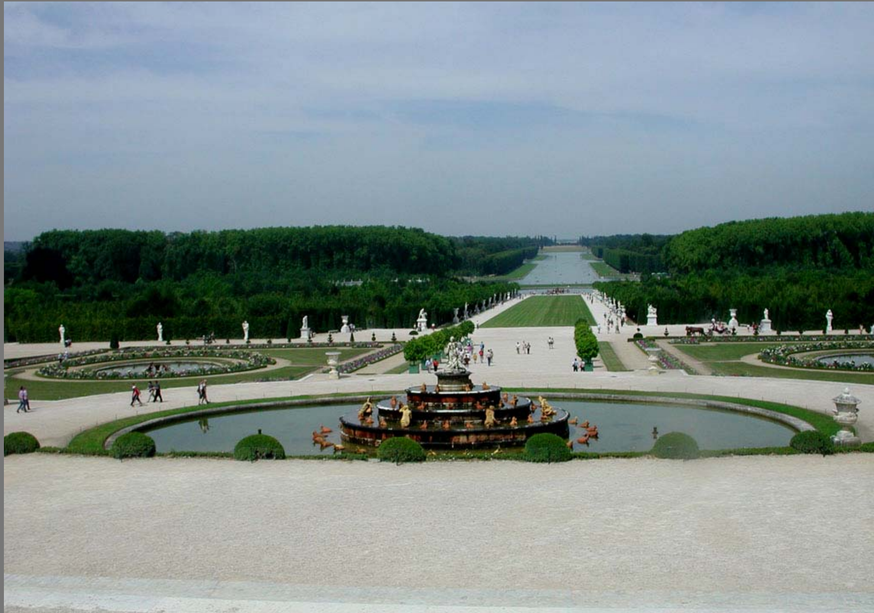
การจัดสวนพระราชวังแวร์ซายน์