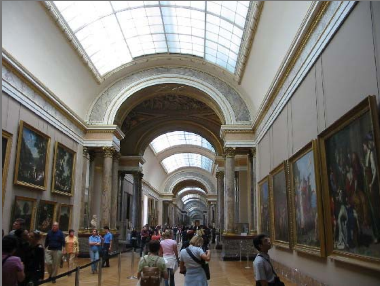
ห้องแสดงงานศิลปะ ภายในลูฟว์