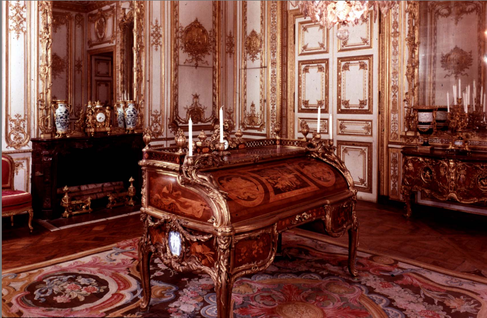
Louis 15 Study