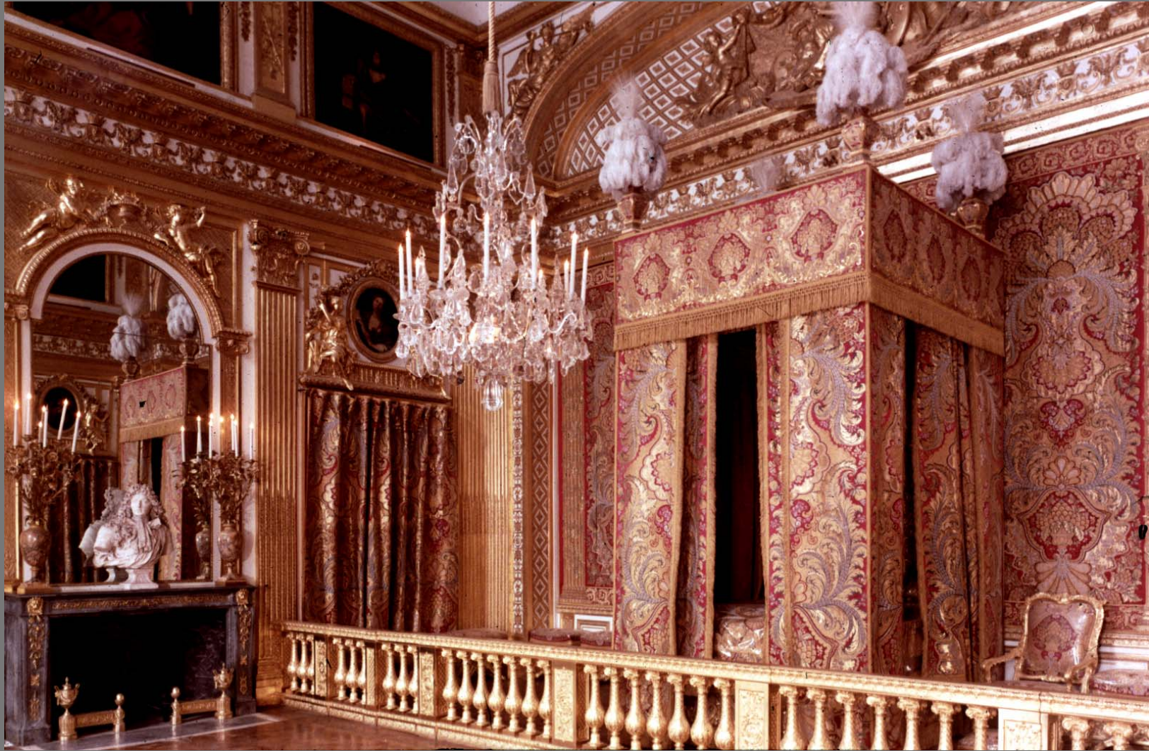
The Queen Bed Chamber