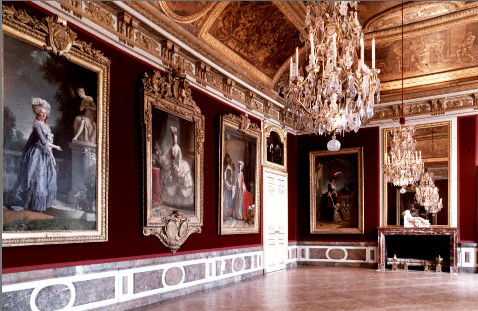
The Queen Waiting Room