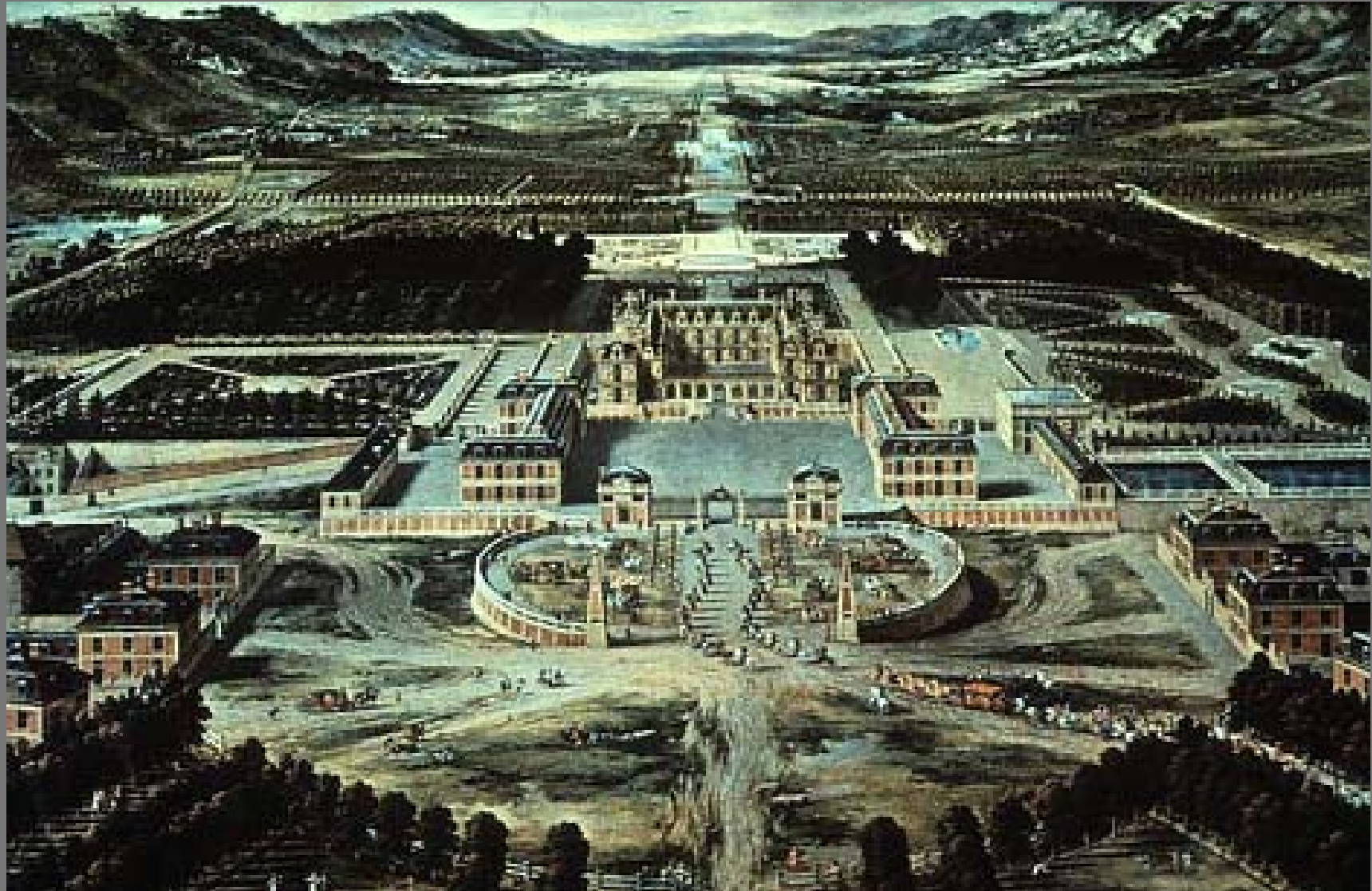
พระราชวังแวร์ซายน์ ค.ศ.1669 - 1685