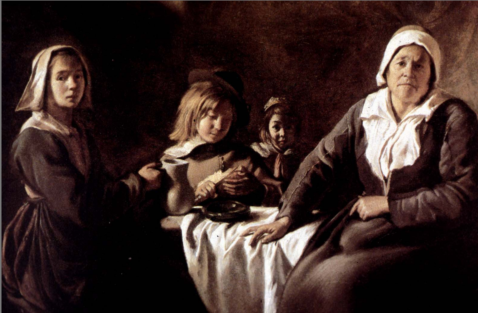
Four Figures at Table หลุยส์ เดอ นัง สีน้ำมันบนผ้าใบ ขนาด 46 X 55 ซม.