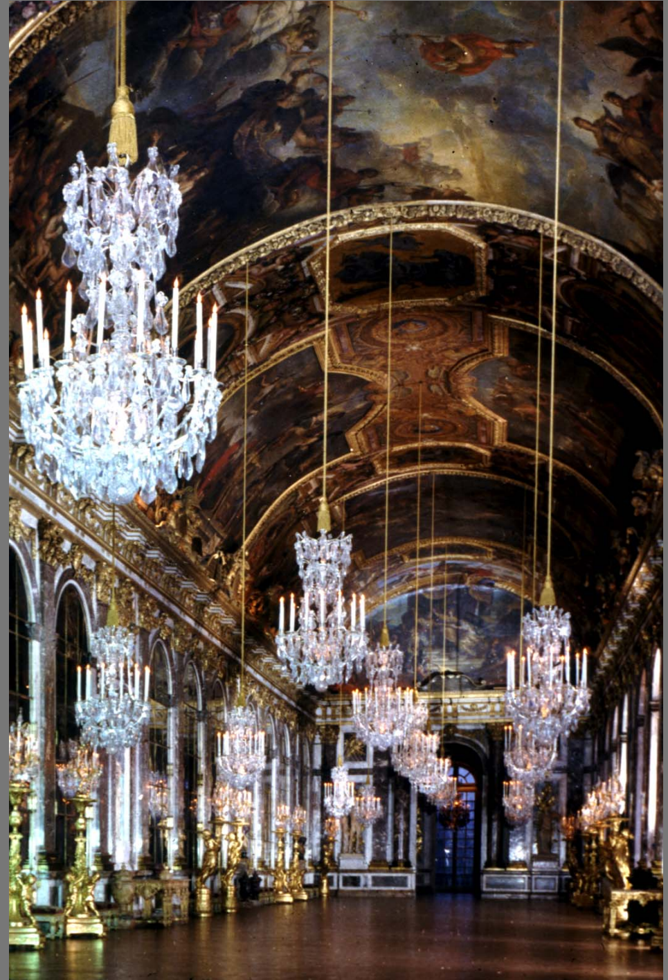
ห้องท้องพระโรงกระจก (The Hall of Mirrors) ออกแบบโดย จูล อาร์คดอง มงซาร์ต