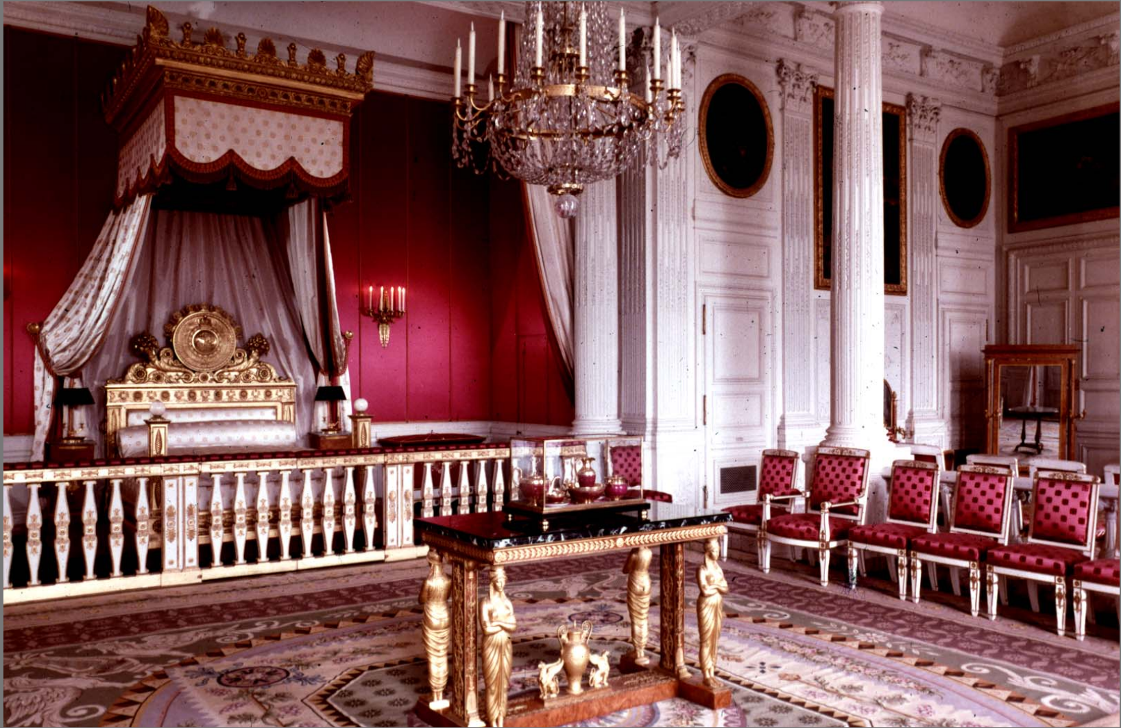
The King Bed Chamber