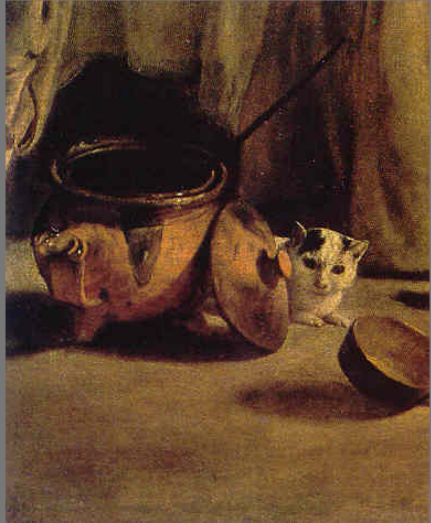
ภาพขยายรูปครอบครัวชาวชนบท