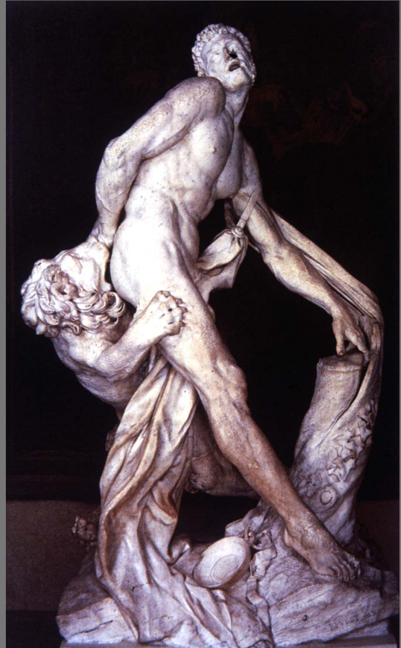
Milo of Cortona หรือไมโลแห่งคอร์โตนา หินอ่อน ค.ศ.1671