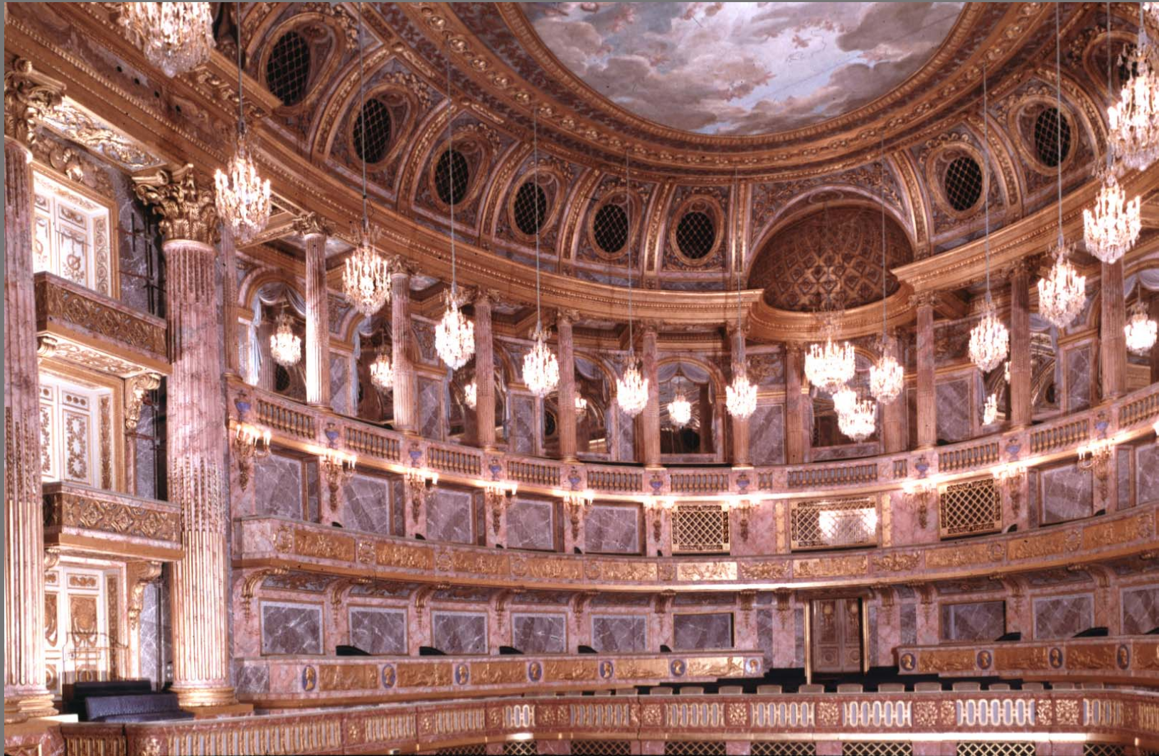
The Royal Opera House