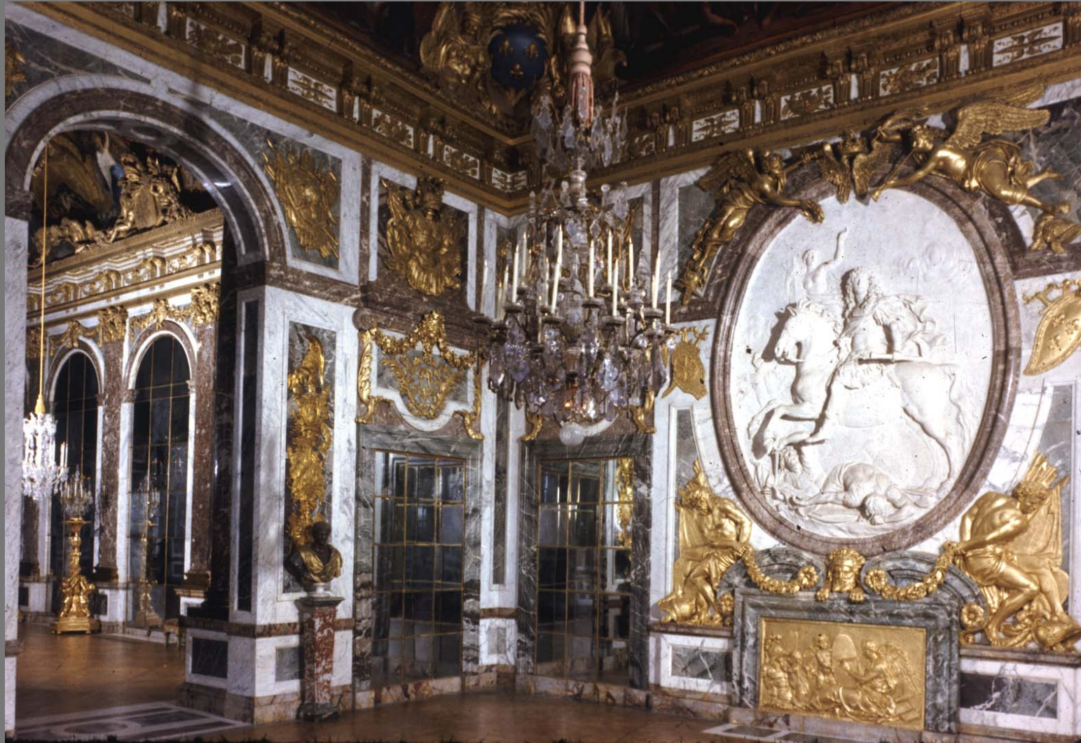
ภายในห้อง The War Room ค.ศ.1678