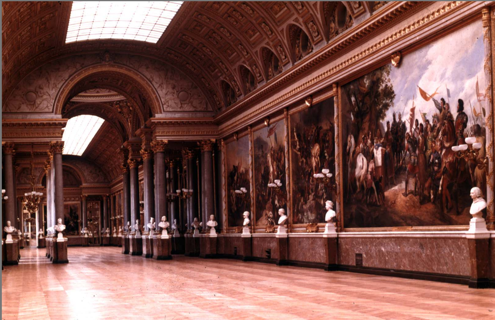
The Battle Gallery