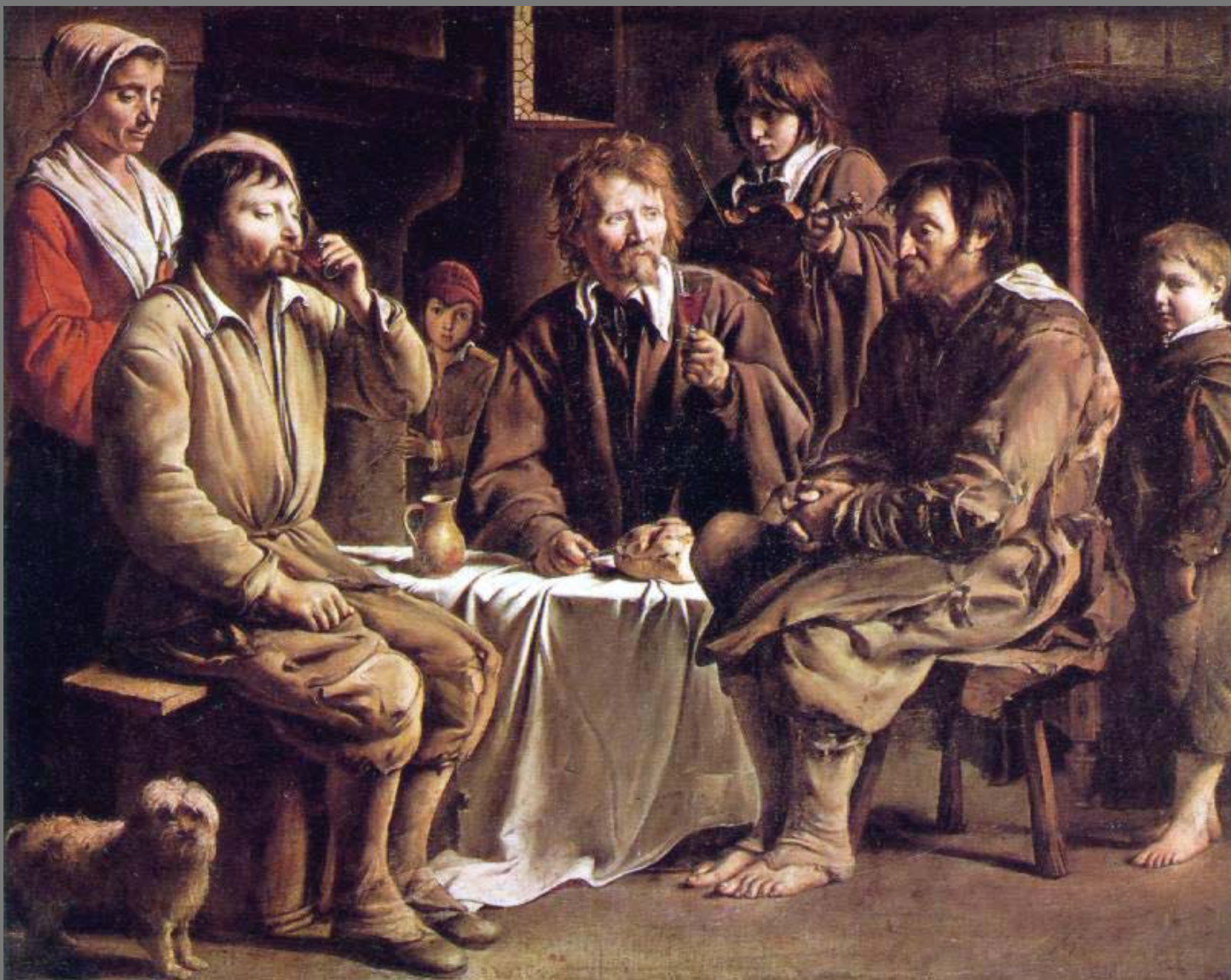
การรับประทานอาหารของชาวนบท ( The Peasants Meal )