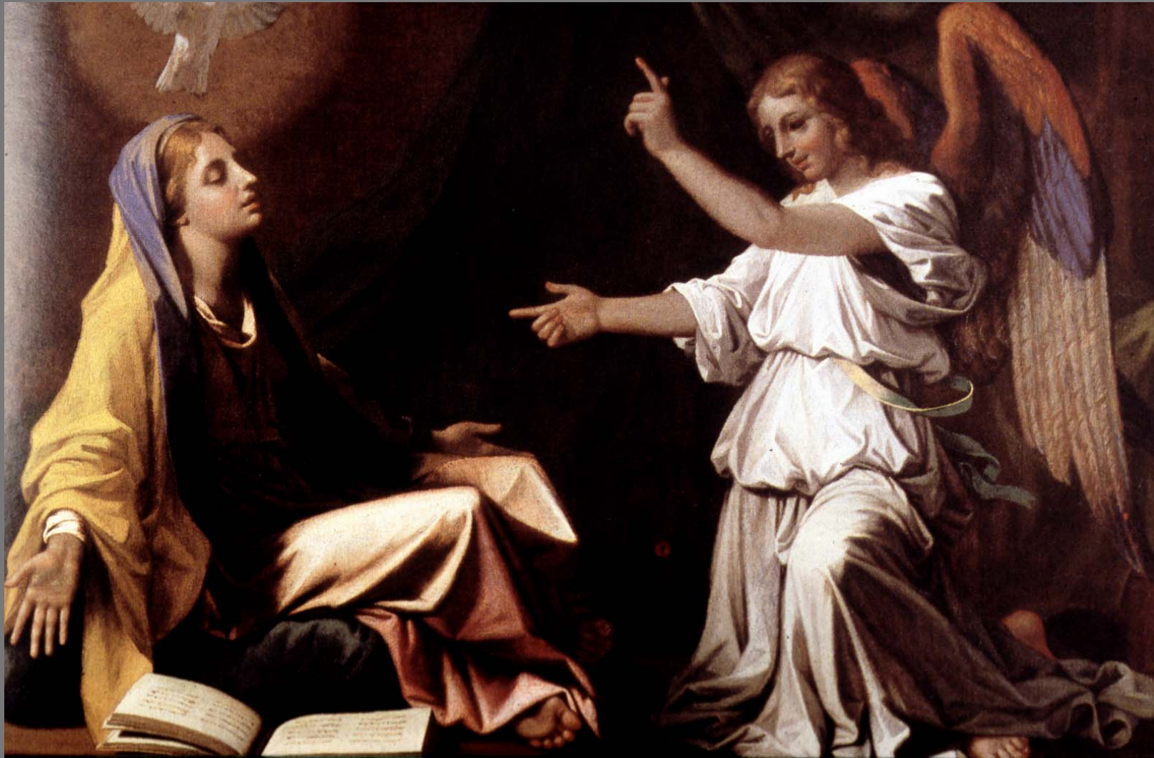
The Annunciation หรือการแจ้งข่าวประเสริฐ