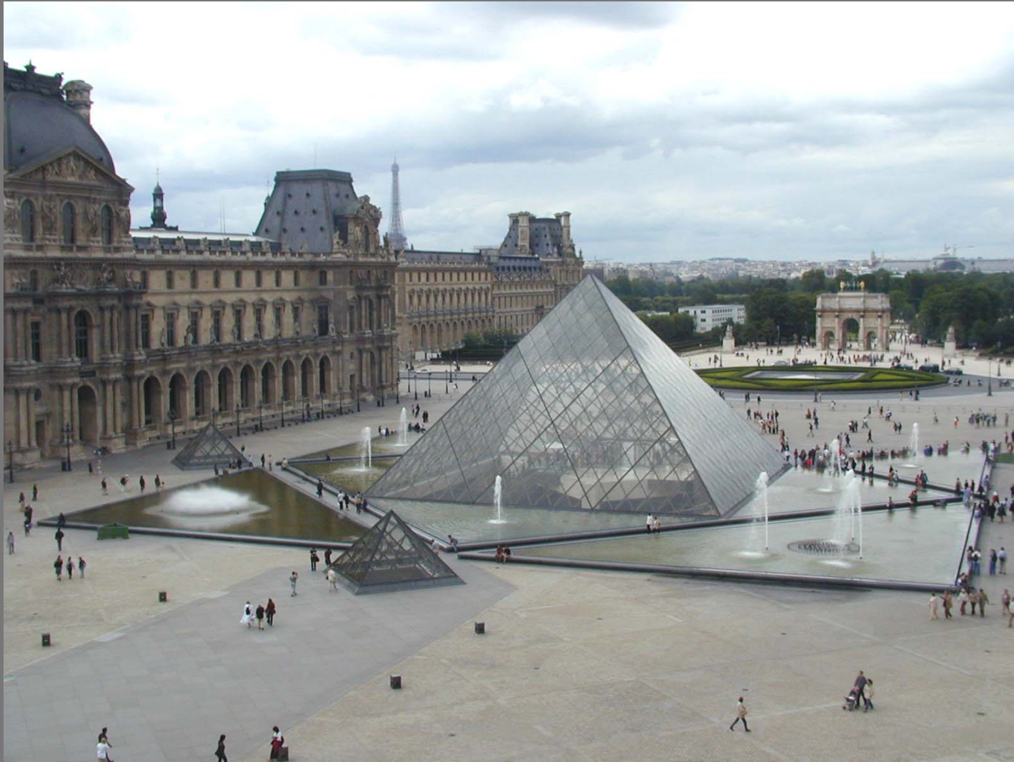
พระราชวังลูฟว์