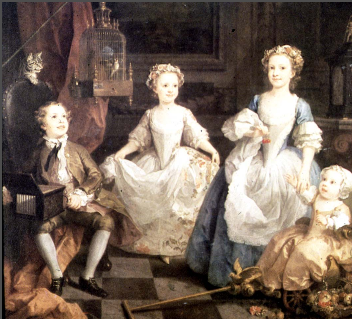
ไฮการ์ธ The Graham Children (เด็ก ๆ ตระกูลเกรแฮม)