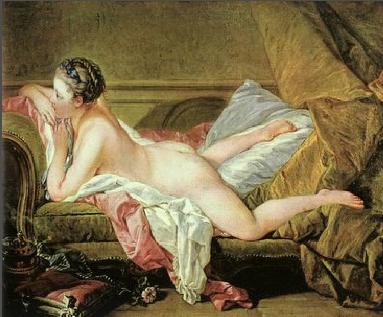
ป็องเชอঁ Reclining Girl ค.ศ. 1752