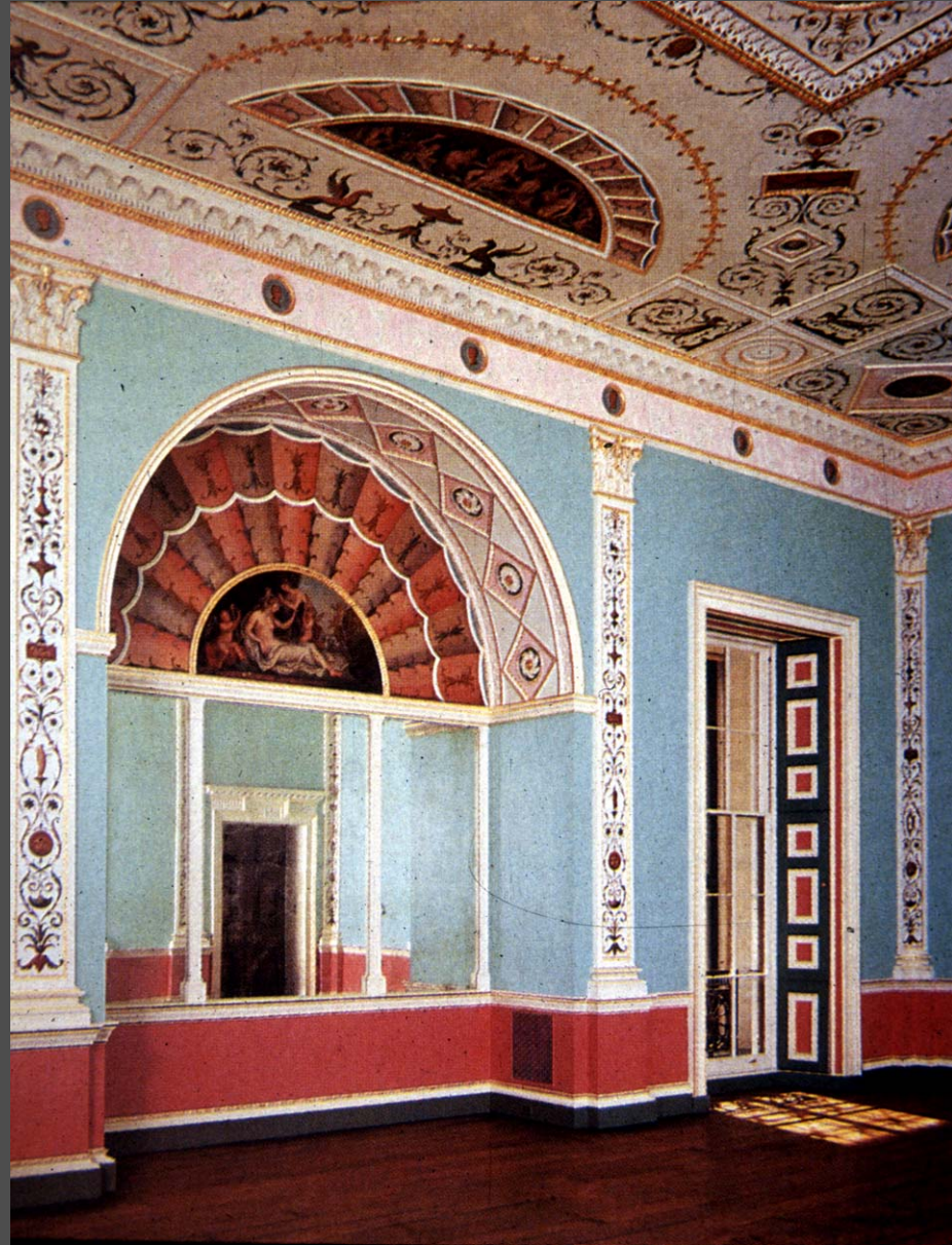
คฤหาสน์ แลนสดาวน์ เฮาส์ (Lansdowne House) ลอนดอน 1765 - 1775