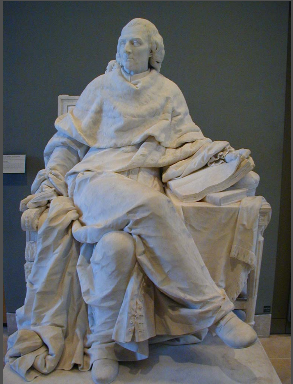
อูดอง ขอร์ช วอชิงตัน หินอ่อน สูง 74 นิ้ว ค.ศ.1788 - 1792