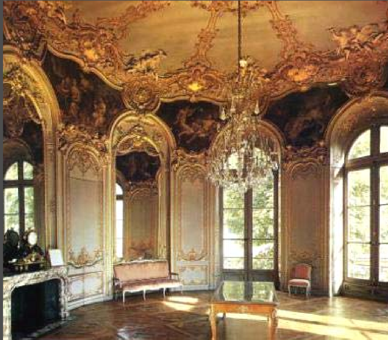
ตกแต่งห้องเจ้าหญิง ในคฤหาสน์ซูบีส (Hotel de Soubise) ค.ศ.1732 — 1740 ตัวอย่างการตกแต่งแบบโรโคโคที่สมบูรณ์แบบที่สุด