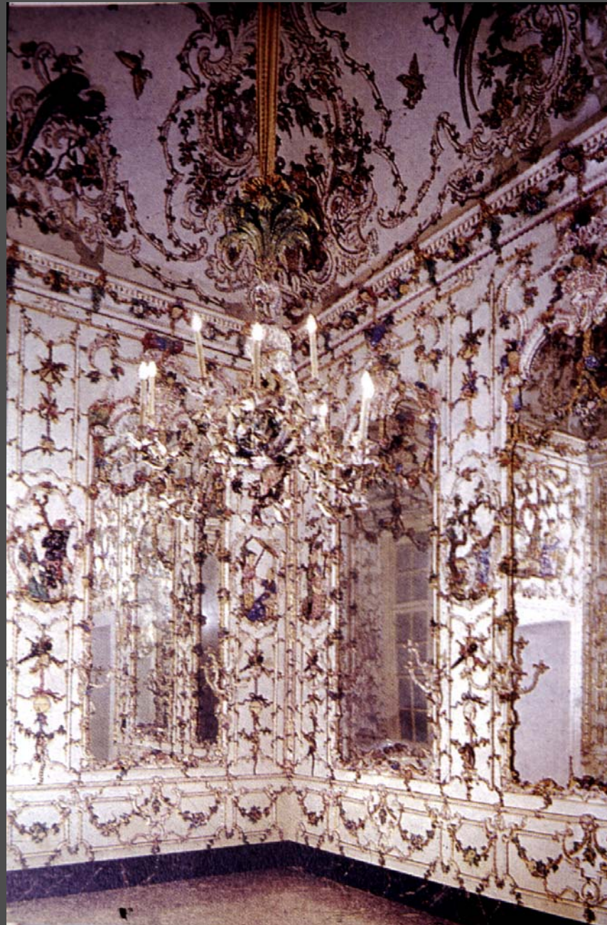
Palace of Portici (อิทธิพล Ceramic จีน) เมืองเนเปิล