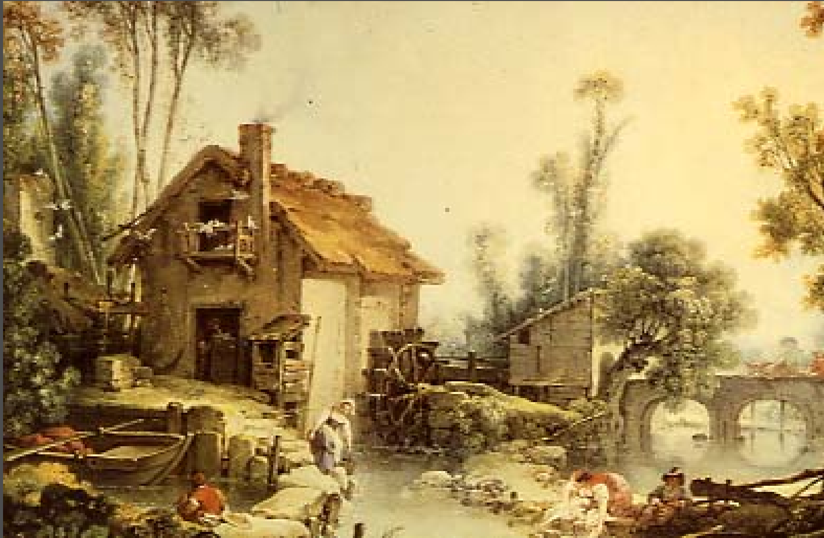
บรูเชอร์ Landscape with a Water Mill สีน้ำมัน 57.2 X 73 ซม.