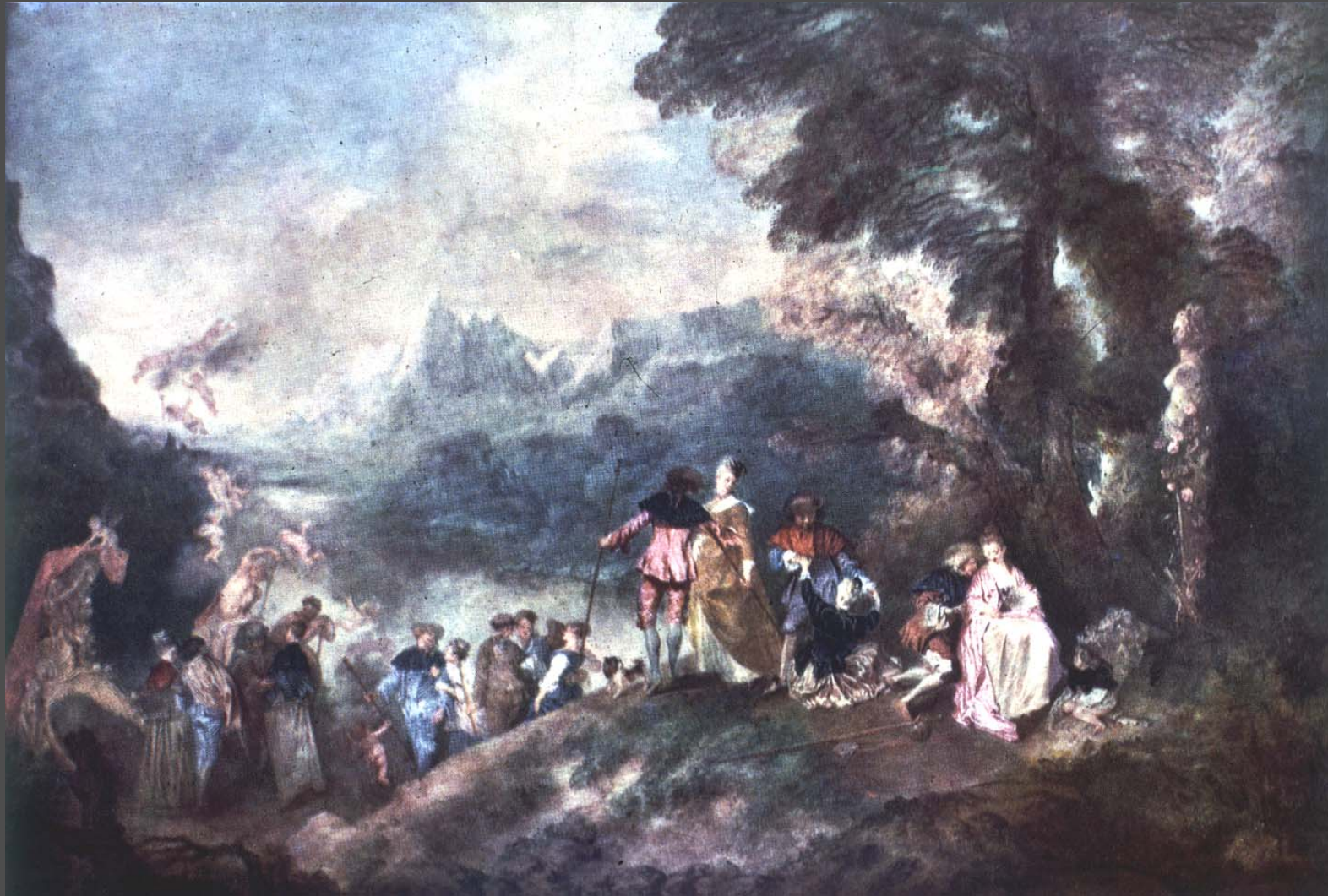
การเดินทางไปเกาะไซธิรา A Pilgrimage to Cythera สีน้ำมันบนผ้าใบ ขนาด 50 X 70 นิ้ว ค.ศ. 1717