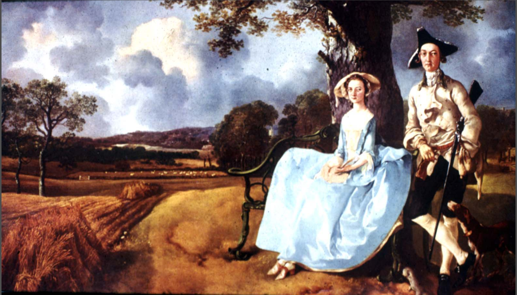
เกนสโบโร Robert Andrew and His Wife (แอนดรูว์กับภรรยา)