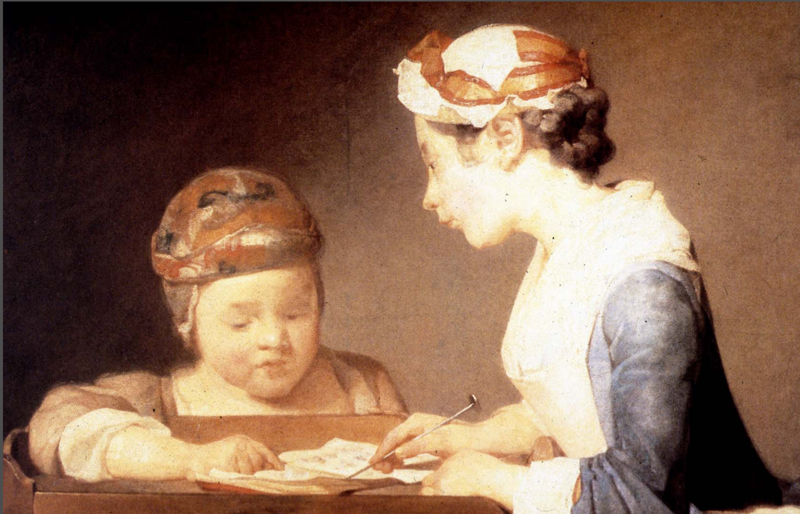
ชาร์แดง คุณครูผู้หญิง~(The Young Schoolmistress)