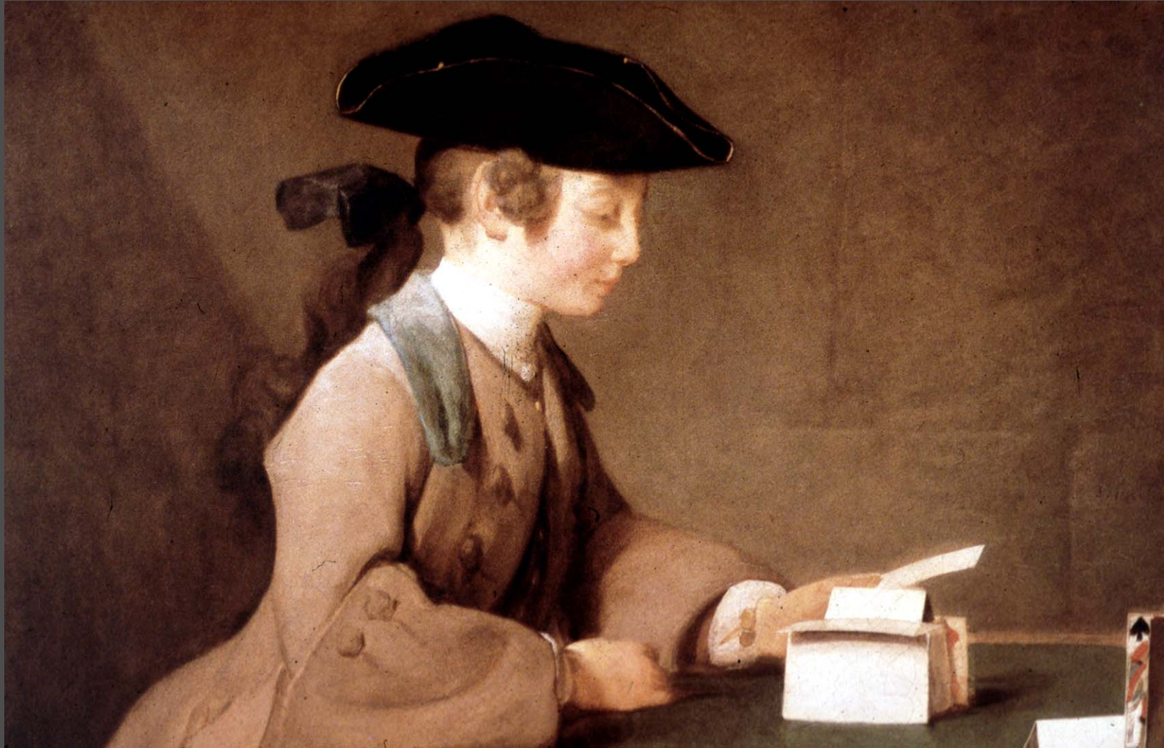
ชาร์ดอง The House of Cards (บ้านกระดาษ)