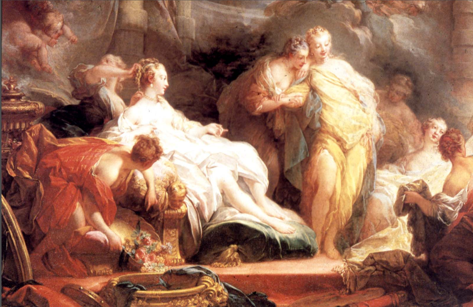
ฟราโกนาร์ต Psyche showing her Sister her Gifts From Cupid