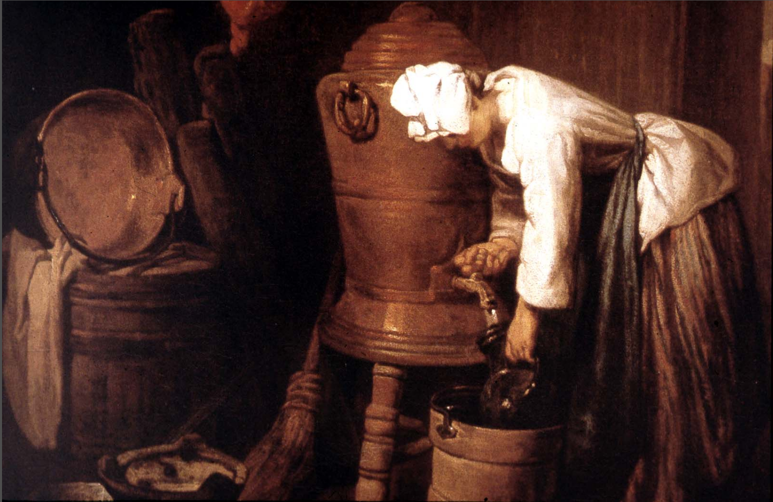
ชาร์แมง The Cistern (ถังน้ำ)