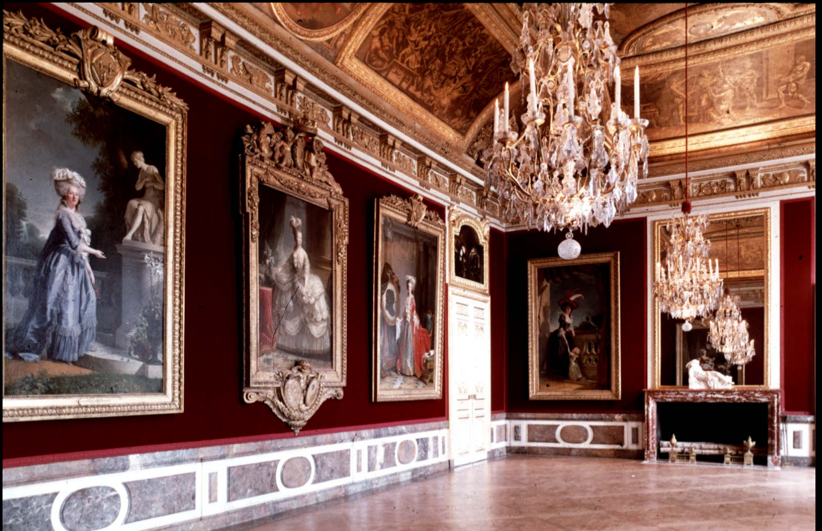
The Queen Waiting Room