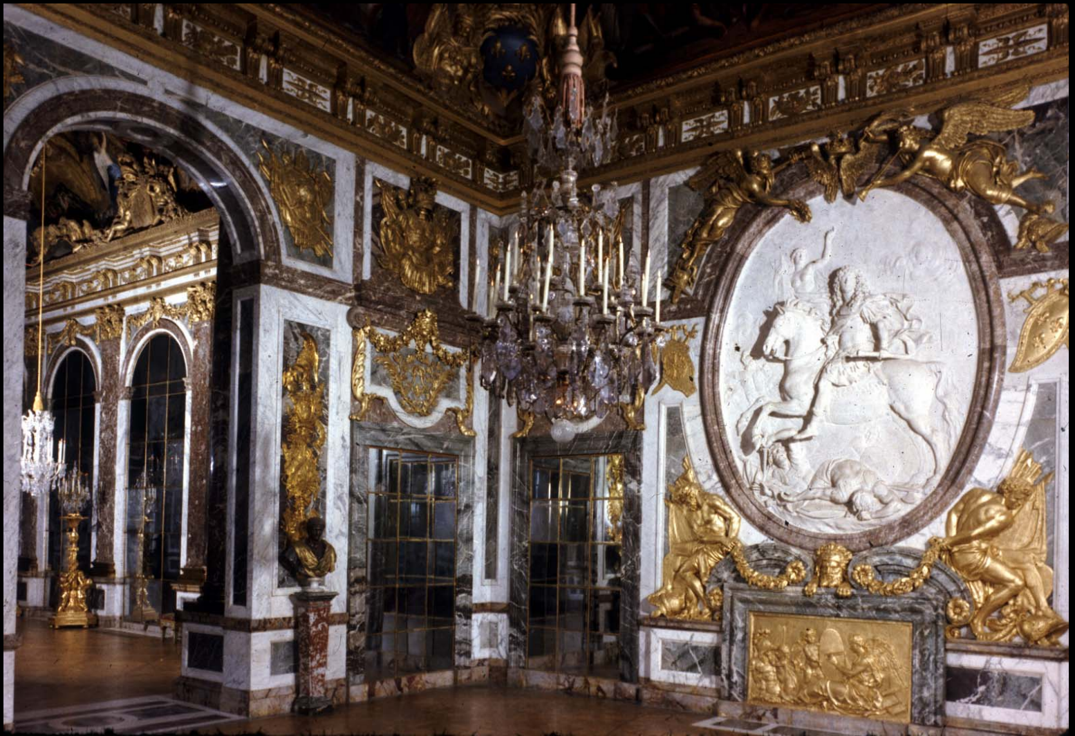
ภายในห้อง The War Room ค.ศ.1678