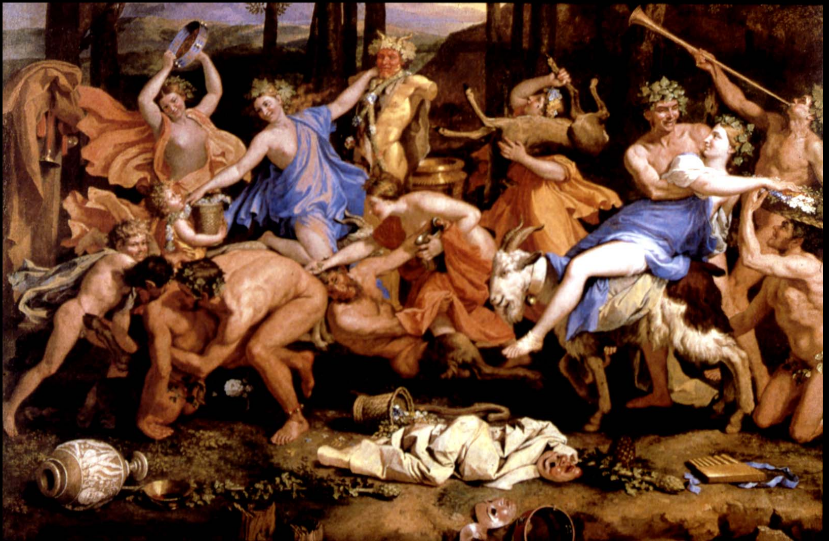
The Triumph of Pan