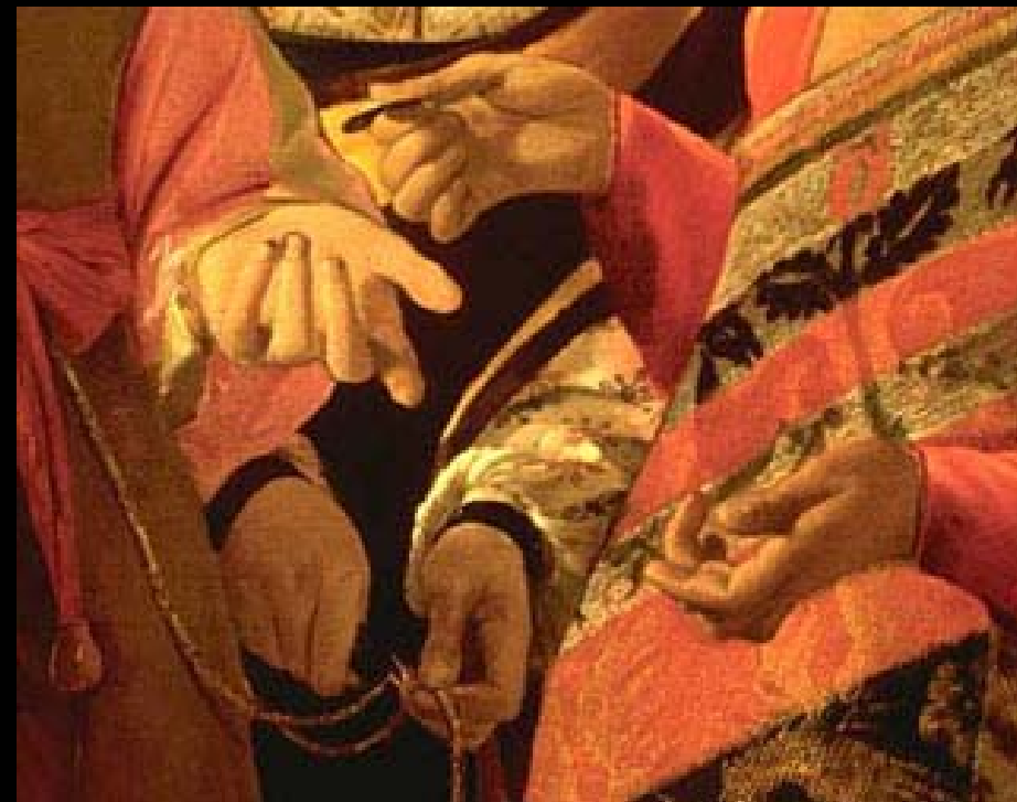
เดอ ล่า ตูร์ Fortune Teller