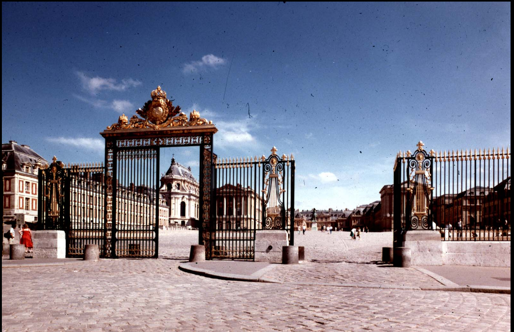
The Main Gateway ค.ศ.1669 - 1685