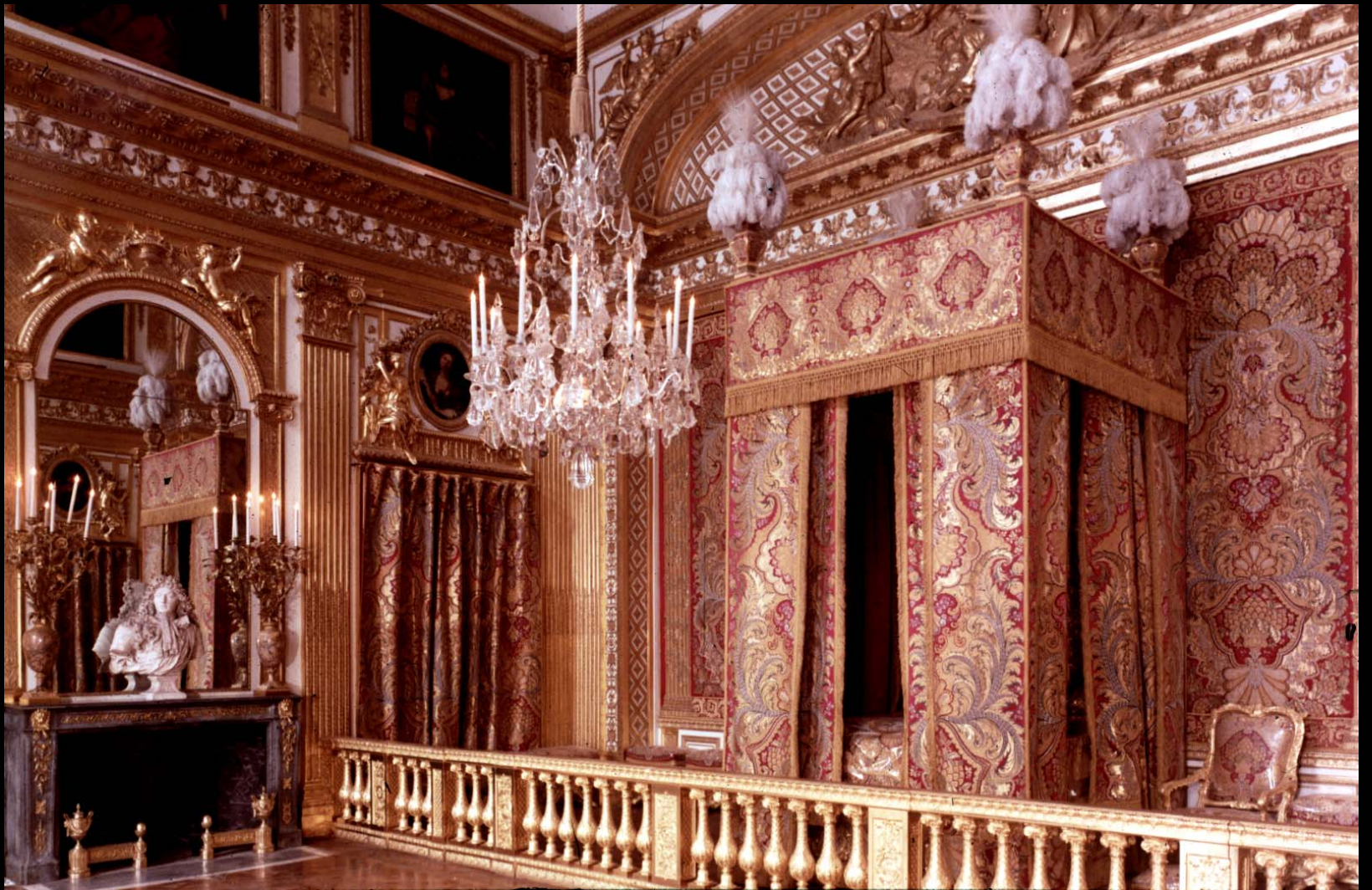
The Queen Bed Chamber