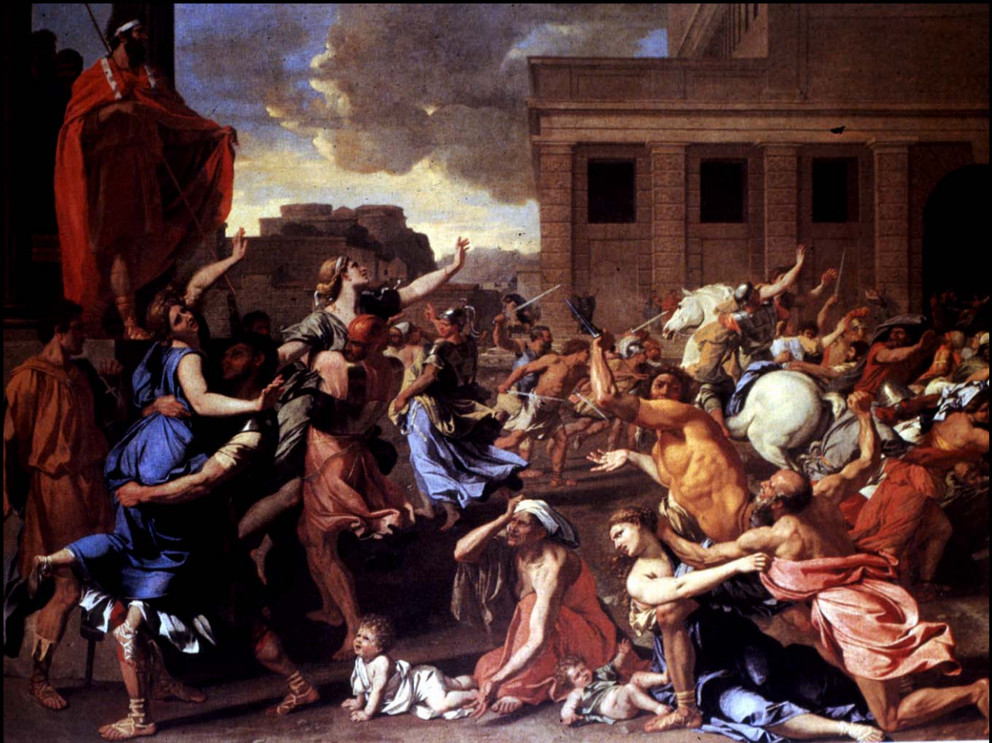
The Rape of the Sabine Women

ค.ศ.1636 – 37 ขนาด 61 X82 ½ นิ้ว สีน้ำมัน