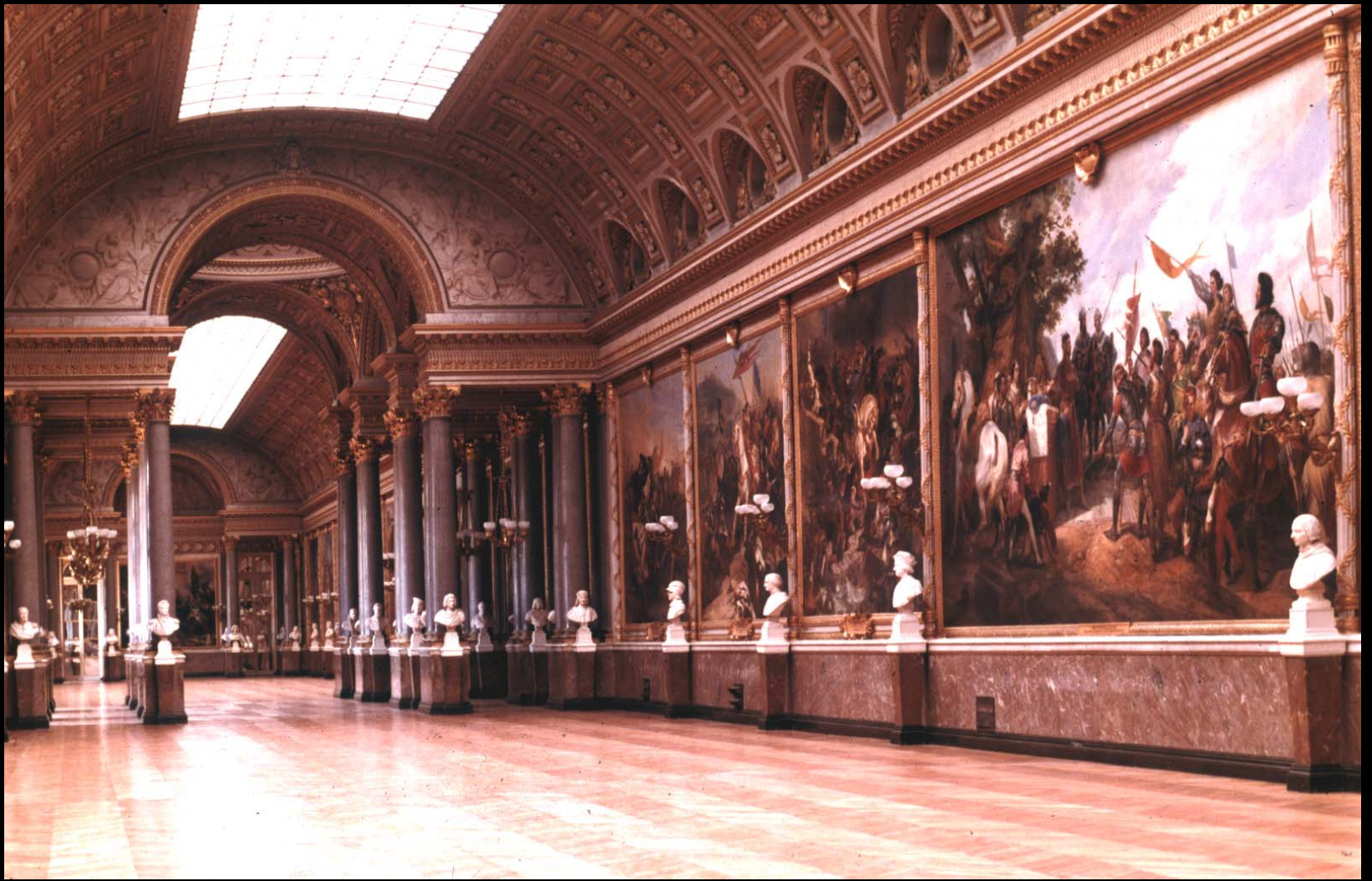
The Battle Gallery