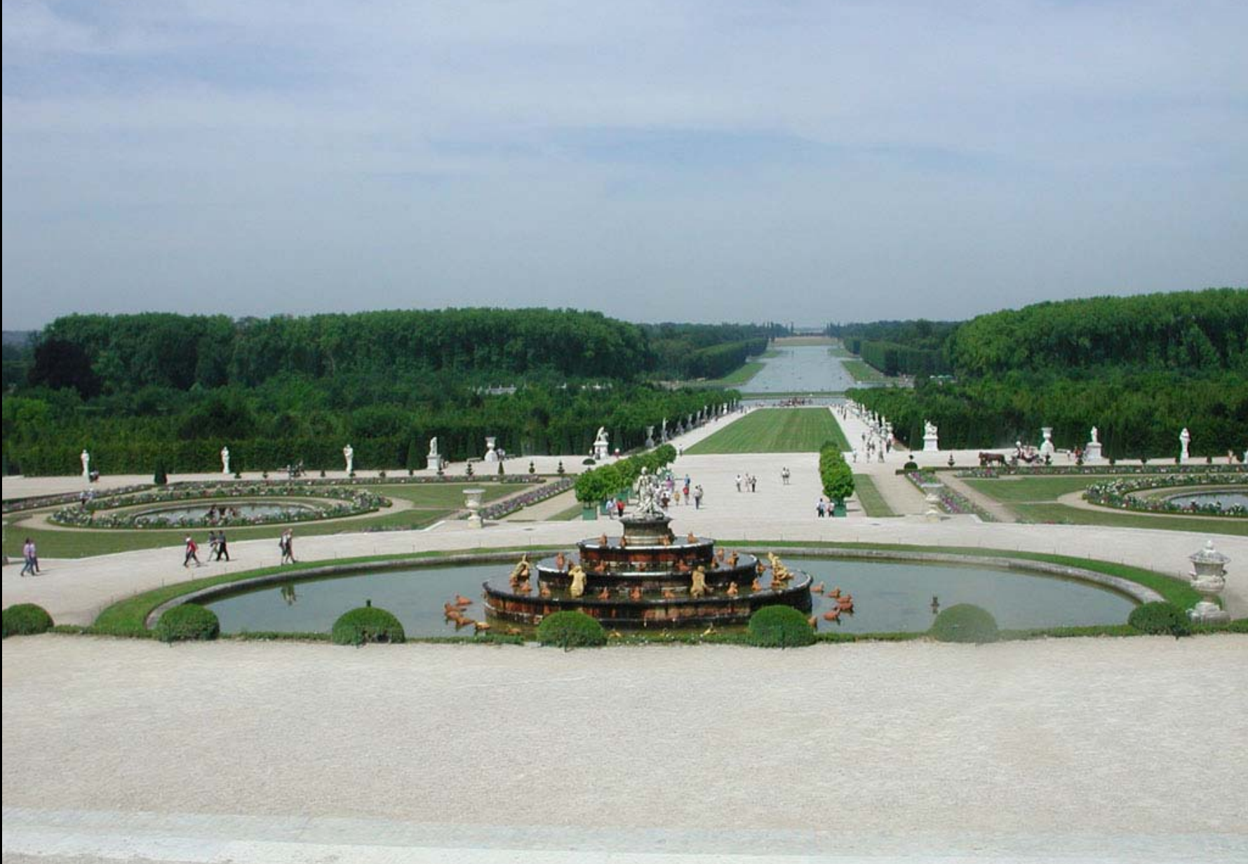
การจัดสวน