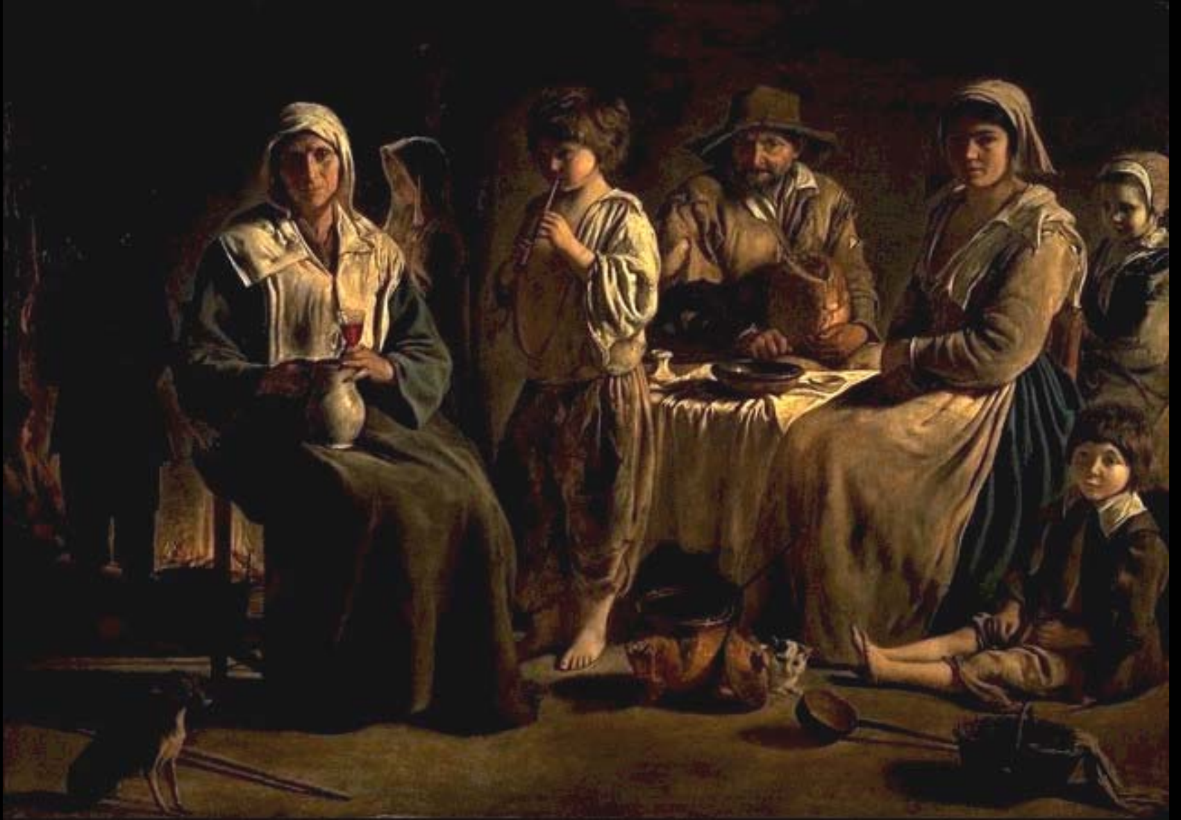
Peasant Family ( ครอบครัวของชาวชนบท )

สีน้ำมันบนผ้าใบ ค.ศ.1640 กว้าง 62 นิ้ว สูง 44