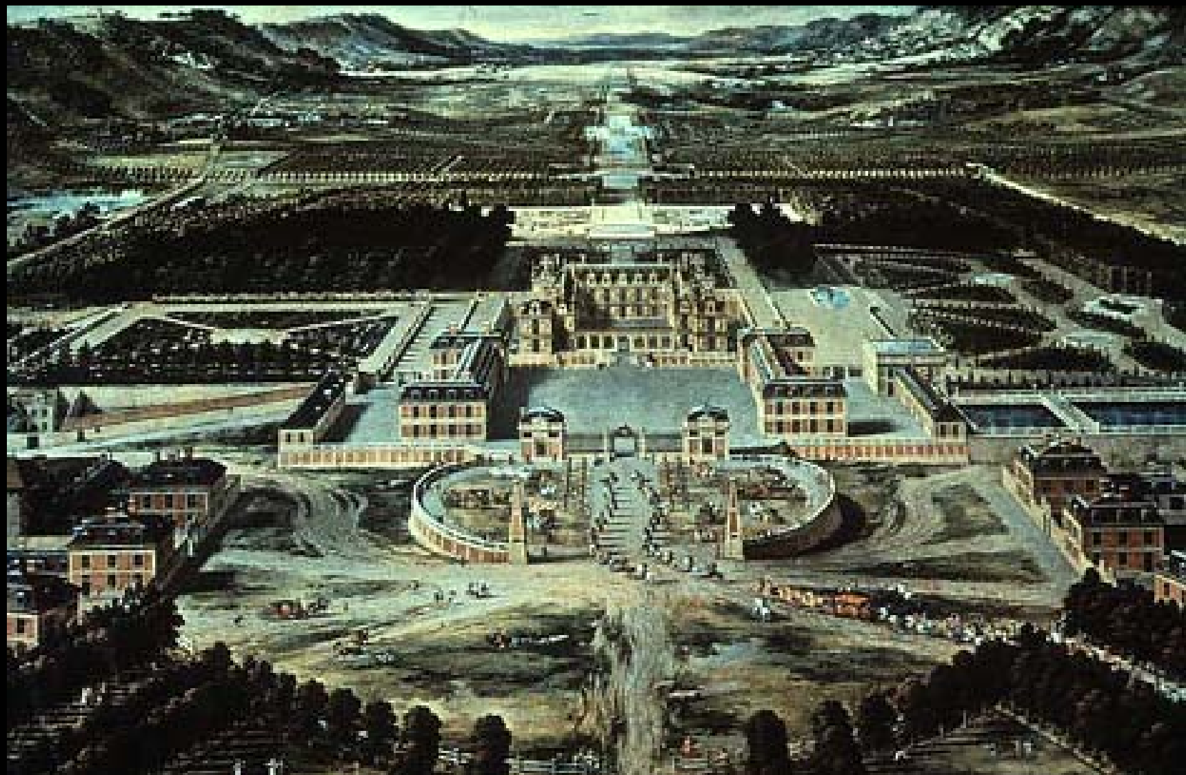
พระราชวังแวร์ซายน์ ค.ศ.1669 - 1685