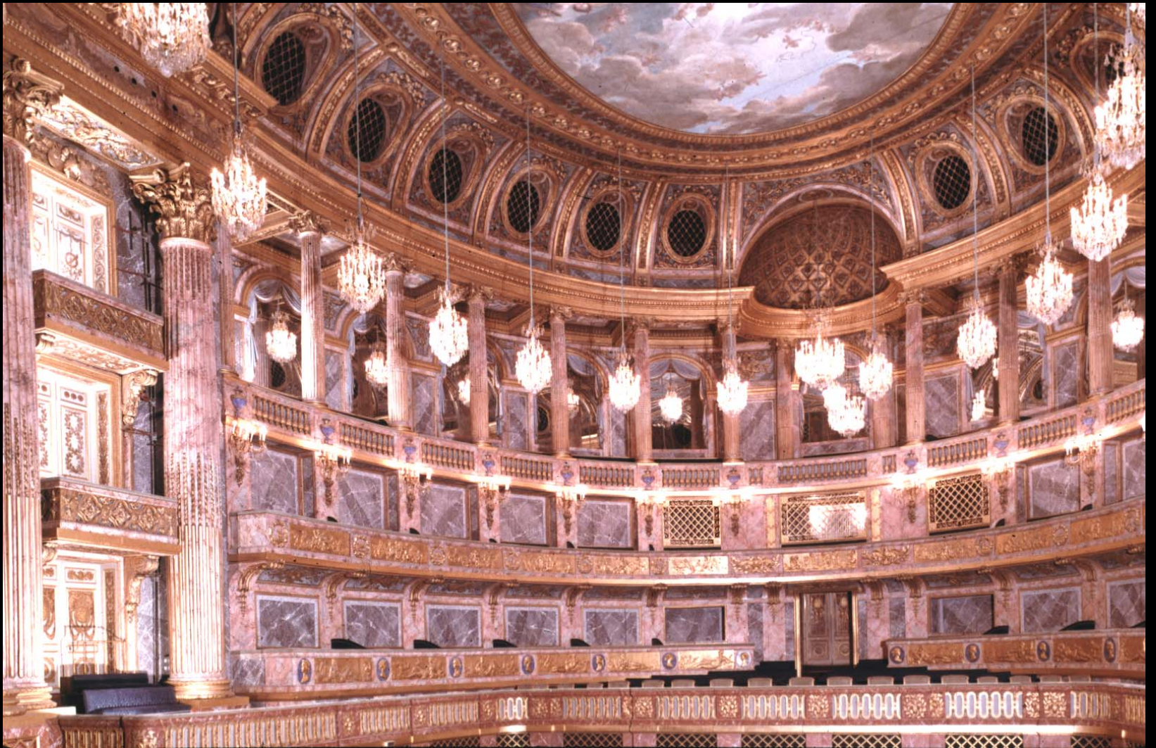
The Royal Opera House