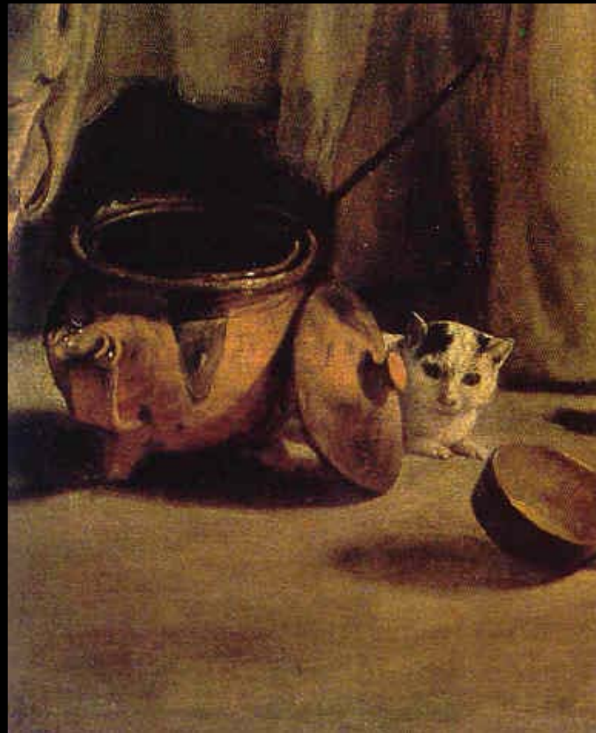
ภาพขยายรูปครอบครัวชาวชนบท