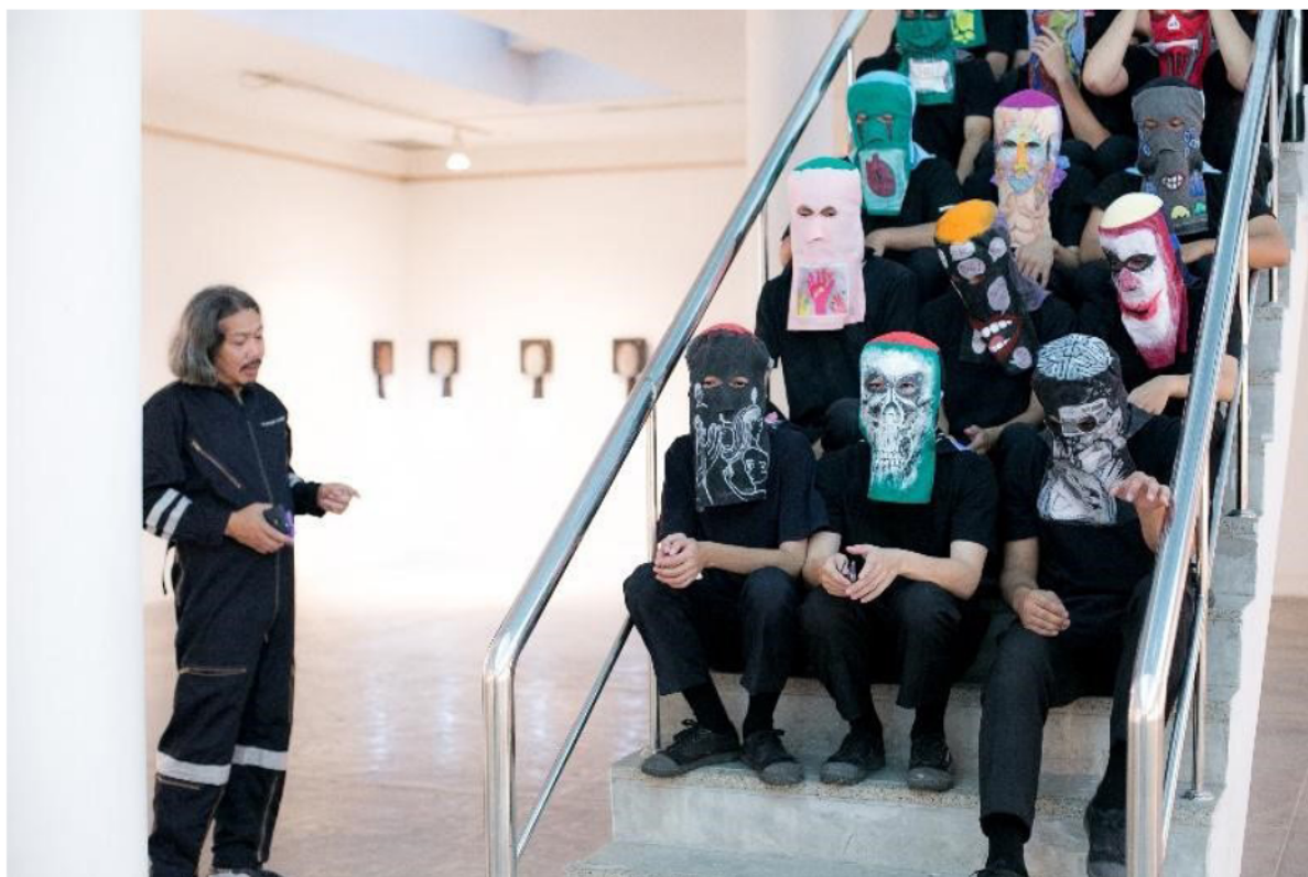
ภาพที่ 3 Performance “Local Mask”