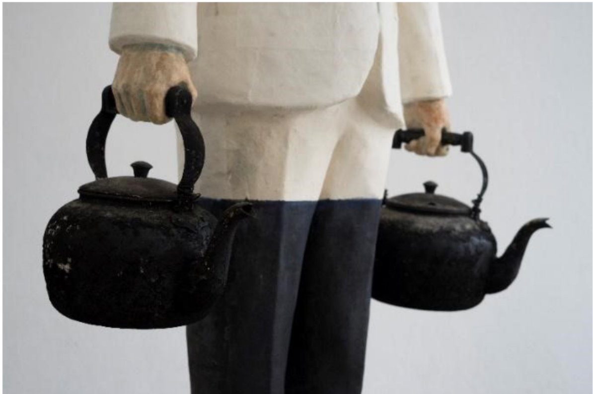
ภาพที่ 6 กาน้ำทั้งสองใบที่เคลือบไปด้วยเขม่าไฟตลอดเวลา 15 ปีที่ผ่านมา

7.1.2 ขั้นตอนการทดลองการสร้างผลงานจากกระดาษระหว่างศิลปินผู้ชำนาญกระบวนการทางเทคนิค และช่างปั้น จนออกมาเป็นผลงานที่สมบูรณ์ พึงพอใจเป็นอย่างมาก ผลงานสื่อถึงอารมณ์และความรู้สึกจากเนื้อกระดาษและการวาดทับ ให้ความรู้สึกรมีชีวิต ประกอบกับวัสดุจริงอย่างกาน้ำทั้งสองใบที่เคลือบไปด้วยเขม่าไฟตลอดเวลา 15 ปีที่ผ่านมา