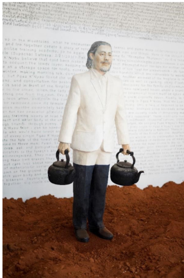
ภาพที่ 9 ประติมากรรม ชายผู้มีกาน้ำสองใบในเชิงสัญลักษณ์พร้อมทำหน้าที่รับใช้จิตวิญญาณของผู้ร่วมเดินทางสู่ฝัน