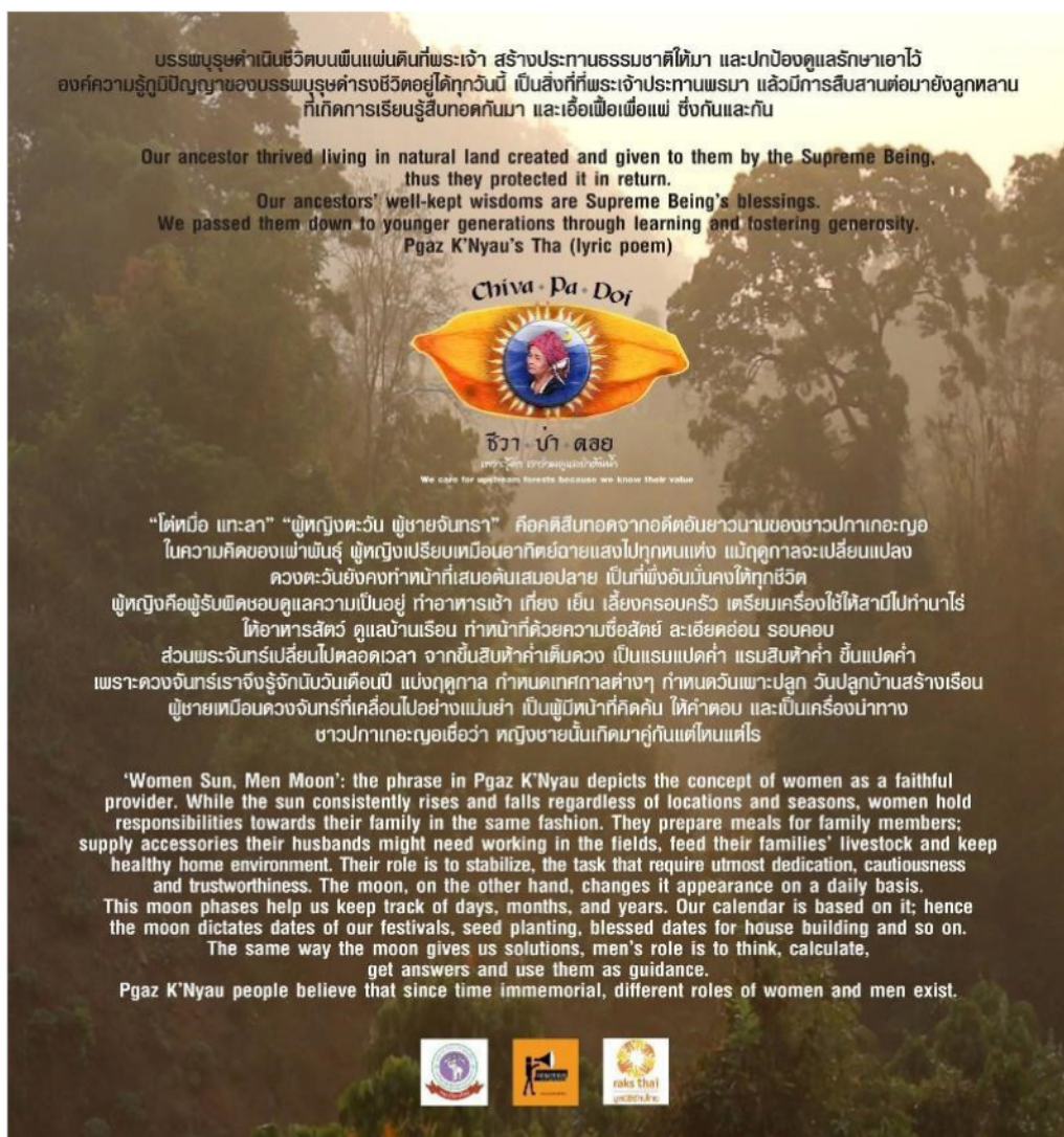
ภาพที่ 4 Design “ชีวาป่าดอย” (© Supachai Sastrasara 2016)

การเข้าไปศึกษาข้อมูลของผู้คนบนดอยเพื่อนำข้อมูลเหล่านั้นกลับมาวิเคราะห์และต่อยอดเพื่อสร้างแนวคิดและกระบวนการออกแบบสัญลักษณ์ของผลิตภัณฑ์ที่สร้างมูลค่าเพิ่มให้แก่ตัวผลิตภัณฑ์ โครงการนี้เกิดขึ้นจากการร่วมมือระหว่างมูลนิธิรักษ์ไทย รำเปิงกระบอกเสียงสถานและคณะวิจิตรศิลป์ มหาวิทยาลัยเชียงใหม่