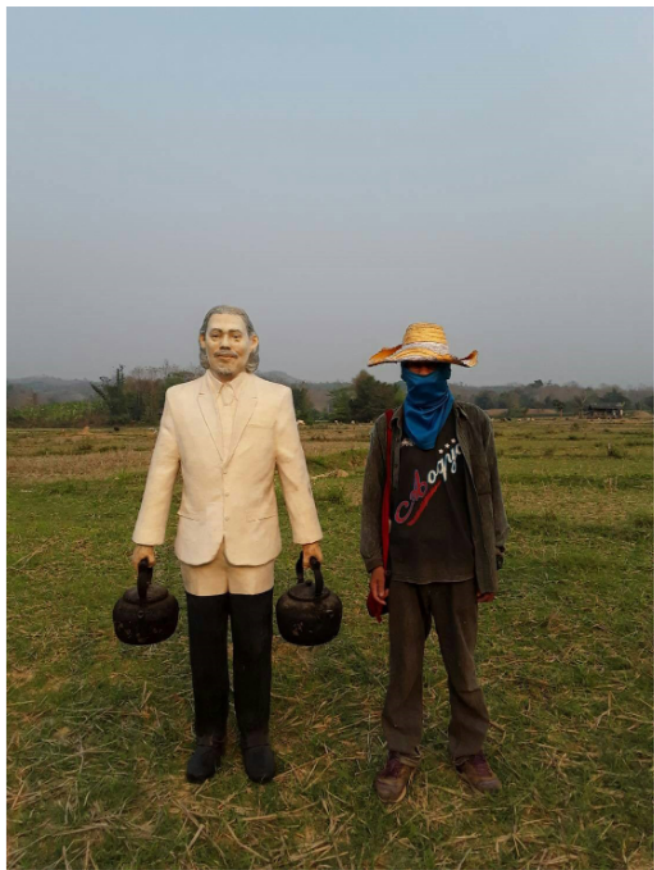
ภาพที่ 11 ประติมากรรม ชายผู้มีกาน้ำสองใบในเชิงสัญลักษณ์ ในสถานที่ต่าง ๆ