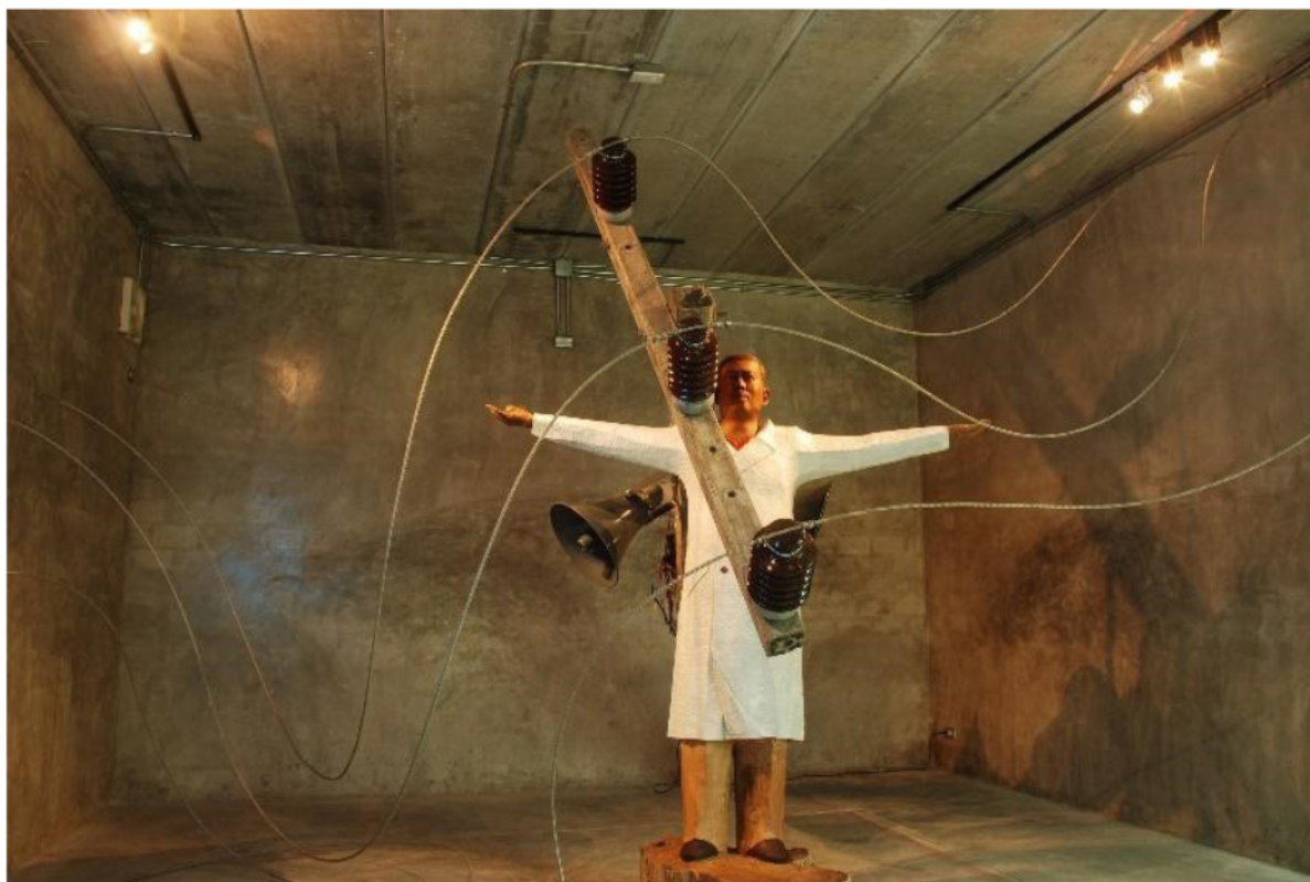
ภาพที่ 1 ผลงาน Sculpture, Installation “Lightning Conductor”

แสงให้เราเห็นสิ่งต่าง ๆ ส่วนต่าง ๆ ของโลกใบนี้ (ใครเป็นผู้กำกับ) “สายกำบังผ่านบ้านผ่านเมือง แมงปากกว้างจะอ้อมกินเงิน” เป็นวลีที่สะท้อนถึงสังคมได้ดี เมื่อไรที่สายแมงมุมถักทอส่งต่อลำเลียงไป แสงก็จะทำงานตามด้วยภาพและเสียง การแปรเปลี่ยน เปลี่ยนแปลงของการเห็นและการได้ยิน ส่งผลต่อการเปลี่ยนแปลงทางความคิด ความรู้สึก และสภาพร่างกายของคนเรา ถ้าเราใช้มันอย่างสร้างสรรค์จะมีประโยชน์ พระเจ้าหรือมนุษย์ใครกันแน่ที่ เป็นผู้สร้างสรรค์