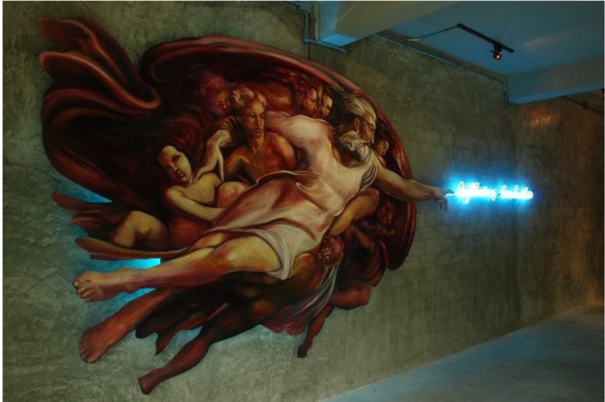
ภาพที่ 2 ผลงาน Sculpture, Installation “Lightning Conductor” (© Supachai Sastrasara 2009)

รายละเอียดของผลงานที่นำภาพเขียนพระเจ้าของศิลปิน Michelangelo (Maher 2019, online) ที่เพดานโบสถ์น้อยซิสทีนนำมาประกอบเป็นผลงานด้วย