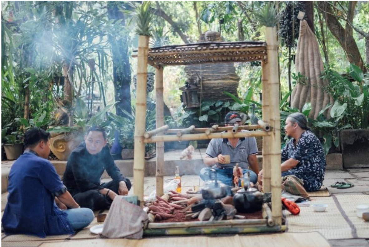
ภาพที่ 8 วงสนทนาวงกลมที่เกิดขึ้นระหว่างคนในเมืองและคนบนดอยเพื่อขยายความหมายของชีวิต