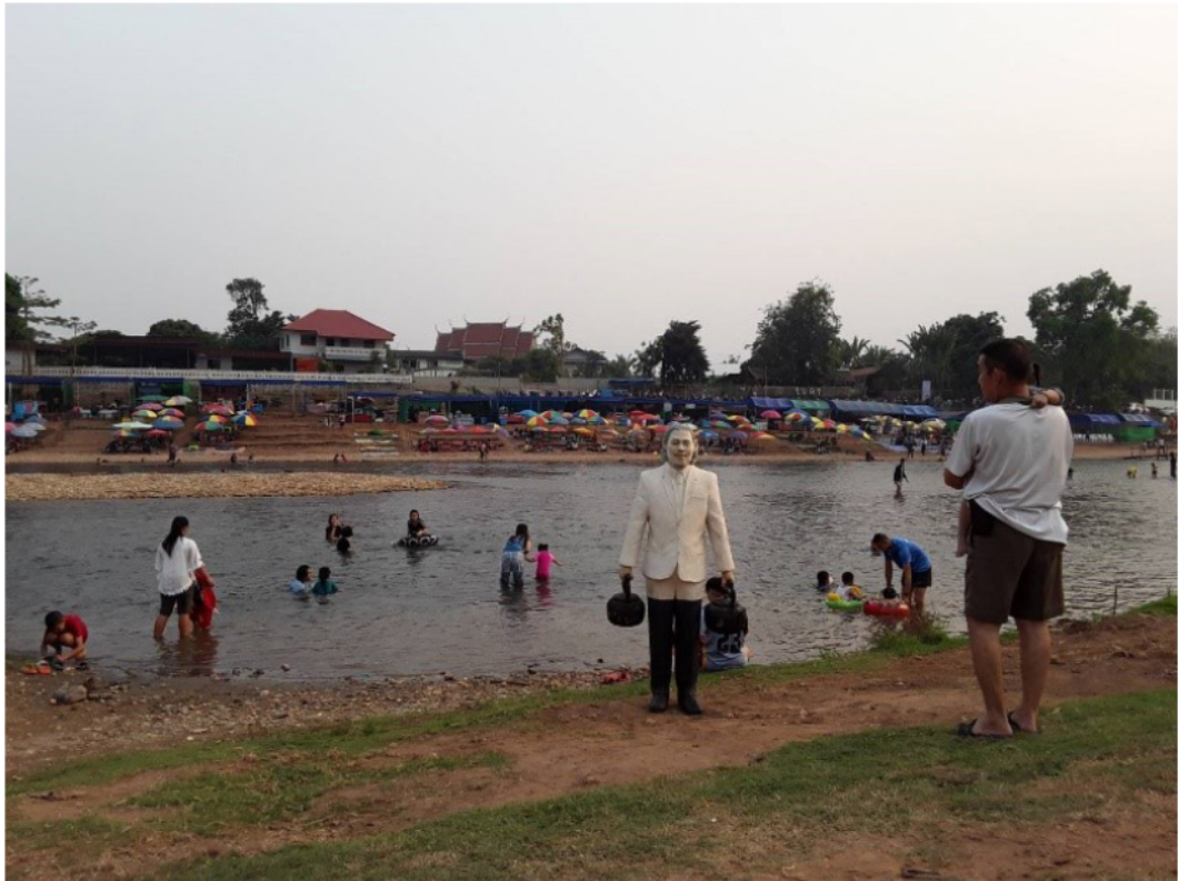
ภาพที่ 10 ประติมากรรม ชายผู้มีกาน้ำสองใบในเชิงสัญลักษณ์ ในสถานที่ต่าง ๆ