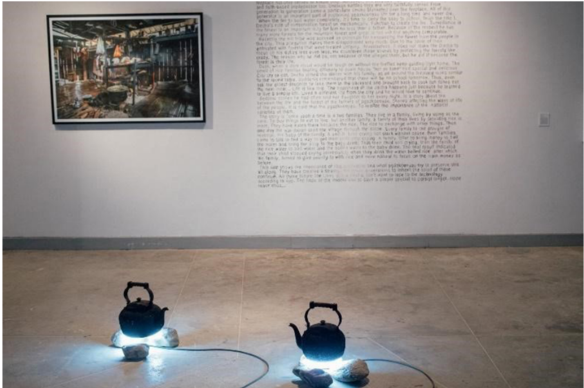
ภาพที่ 5 Installation “Decha of mountain, the man who have two kettles”